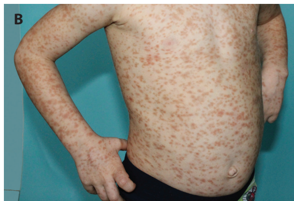
Obr. 4. Čtyřletý chlapec s projevy od čtyř měsíců věku