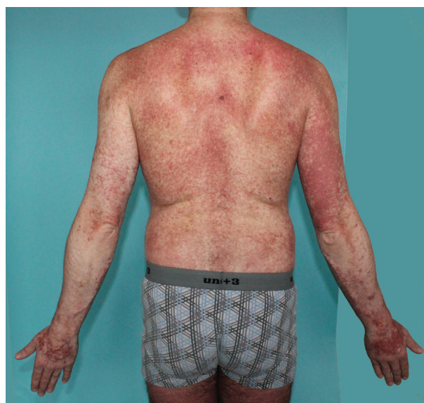
Obr. 5. Pacient s projevy od 36 let Mediátorové příznaky nemá, splňuje diagnostická kritéria pro systémovou mastocytózu – indolentní formu, potvrzena mutace c-kit D816V, t. č. bez mediátorových příznaků, bez léčby, pouze pravidelně sledován na hematologii

Dětská mastocytóza často regreduje do puberty, více než u 60 % případů dochází k úplné regresi, u 20 % ke zmírnění projevů. Difuzní kožní mastocytóza může být spojena se závažnými mediátorovými projevy a komplikacemi, ale i v těchto případech často dochází k redukci kožního postižení