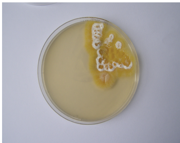
Obr. 3a. Masivní nález Arthroderma benhamiae na Sabouraudově agaru s chloramfenikolem

K léčbě infekcí způsobených Arthroderma benhamiae je doporučován na prvním místě terbinafin, alternativou