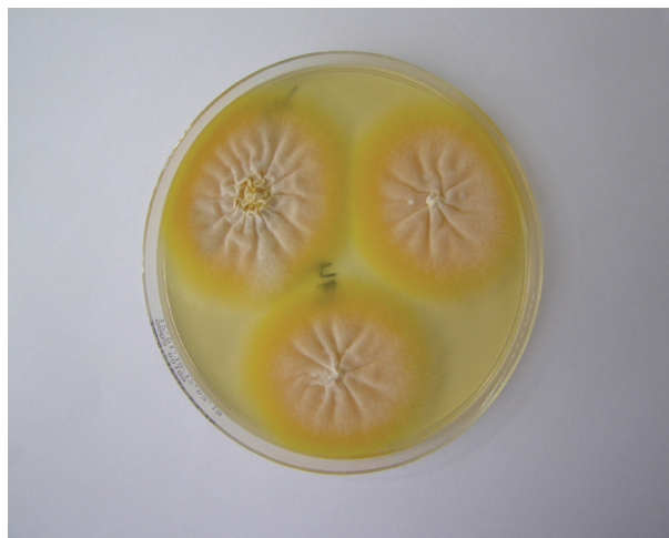
Obr. 3b. Masivní nález Arthroderma benhamiae na Sabouraudově agaru s chloramfenikolem