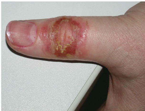
Obr. 1. Klinický nález na palci LHK 2/2017 před léčbou antimykotiky

s centrálním výbledem. Na zarudlé spodině byly přítomny vezikuly až pustuly, místy erodované. Pacientka byla afebrilní, bez celkové alterace stavu.