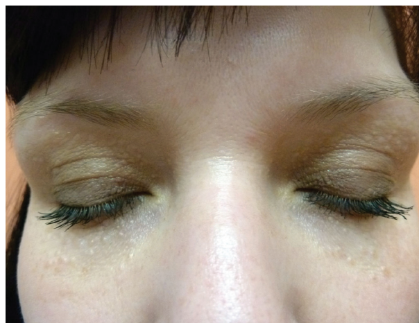
Obr. 1. Syringomy v okolí očí

Při vyšetření jsme kolem očí našli mnohočetné, polokulovité, hladké papuly 1–5 mm velké, normální barvy, které ji subjektivně neobtěžovaly (obr. 1). Diferenciálně diagnosticky jsme zvažovali především syringomy, a to i s ohledem na rodinnou anamnézu. Pro potvrzení dia-