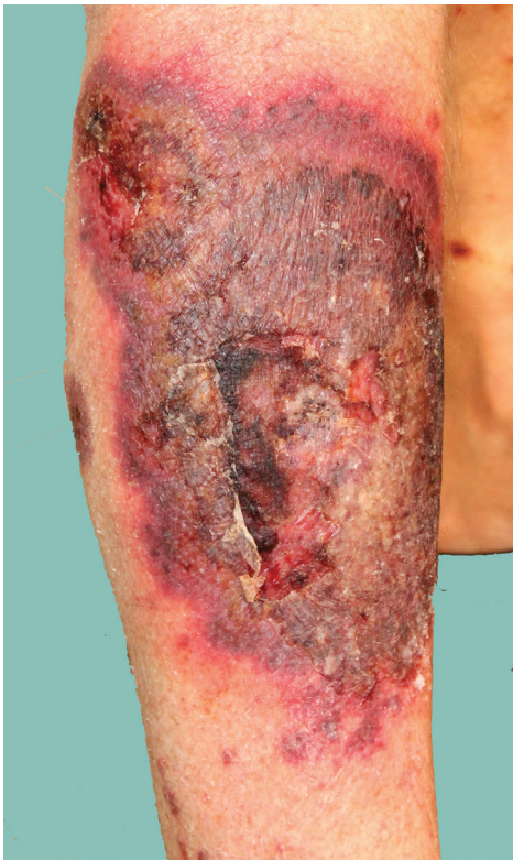
Obr. 4. Projev na lýtku charakteru pyoderma gangrenosum

kým obrazem připomínal pyoderma gangrenosum (obr. 4). K histologické verifikaci nebylo přistoupeno. Filgrastim a azacitidin byly hematologem vysazeny. Při lokální léčbě kombinací betamethasonu dipropionátu s gentamicinem došlo k regresi nálezu.