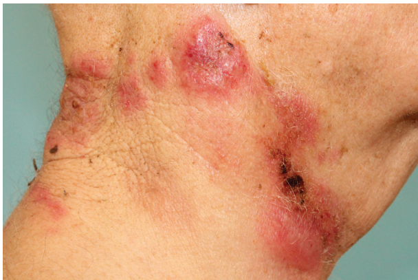
Obr. 2. Palpačně bolestivé infiltráty na kůži krku, některé anulárního uspořádání