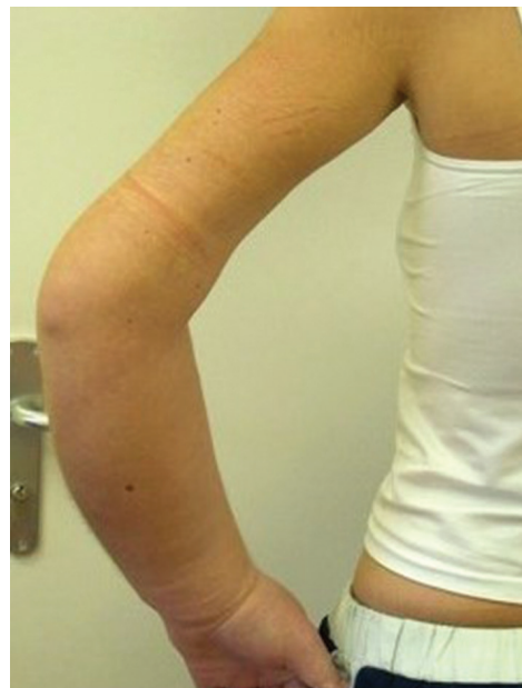
Obr. 4b). Strangulační rýha na levé paži

v souvislosti s jednou z opakovaných hospitalizací na infekčním oddělení, při které byla zachycena výrazná diskrepance v hodnotách tělesné teploty na různých místech těla a velké výkyvy teploty během krátké doby (za hodinu z 39 °C na 36,5 °C). Pacientka byla léčena ambulantně i ústavně na psychiatrii pro poruchy osobnosti a deprese, měla problémy v rodinných vztazích. Na dermatologickém oddělení byla ordinována kompresivní terapie, pacientka byla zvýšeně sledována, zaškrcování se však nepodařilo prokázat. Došlo k rychlé úpravě stavu a propuštění do domácí péče. O tři měsíce později byla pacientka hospitalizována znovu, tentokrát pro otok levé