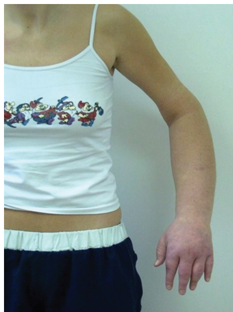
Obr. 4a). Otok levé horní končetiny způsobený jejím zaškracením

Pacientka ve věku 27 let byla odeslána k hospitalizaci na kožní oddělení pro otoky levé dolní končetiny k vyloučení poruchy lymfatické drenáže. V předchozích dvou letech byla opakovaně hospitalizována pro ataky dušnosti, horeček a polymorfní potíže v mnoha nemocnicích po celém kraji. Udávala polyvalentní alergii, užívala čtyři druhy bronchodilancií, dále methylprednisolon, zolpidem (hypnotikum), mirtazapin, escitalopram (antidepresiva) a řadu dalších medikamentů zahrnujících různé doplňky stravy, vazodilatancia, analgetika. V minulosti bylo vysloveno podezření na Münchhausenův syndrom