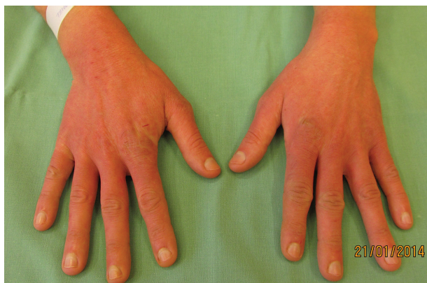
Obr. 3. Rukavicové postižení rukou, erytém až purpurový nádech kůže

noc (antipsychotikum). Pacient nejdříve odmítal hospitalizaci, jako důvod udával strach z nálezů. Pro tuto obavu si umýval ruce několikrát denně, často myl i další části těla. Objektivně bylo přítomno rukavicové postižení rukou (obr. 3), erytém, lichenifikace a xeróza kůže na hřbetech rukou a dlaních, drobné ragády. Během hospitalizace bylo provedeno psychiatrické vyšetření se závěrem obsedantně-kompulzivní porucha. Výsledky epikutánních testů (Standardní evropská sada) a test alkalirezistence byly negativní. Byla navýšena dávka fluvoxaminu (150 mg/den), lokálně byl léčen steroidními externy a emolenciemi. Omezení frekvence mytí rukou bylo za hospitalizace dosaženo krytím obvazy. Pacient byl předán do péče spádového psychiatra, nespolupracoval, neužíval léky podle doporučení, několikrát odmítl hospitalizaci na psychiatrickém oddělení (jedním z udaných důvodů bylo, že musí vyřešit nakaženou oblast konečníku, kterou si několikrát denně drhne kartáčkem, současně došlo ke zhoršení stavu rukou). Po opakovaných intervencích rodiny a psychiatra však nakonec s hospitalizací souhlasil, v nemocnici bylo dohlédnuto na dodržování farmakoterapie a po její úpravě se stav pacienta výrazně zlepšil. V důsledku omezení mytí rukou se zlepšil i kožní nález. V současnosti užívá kombinaci antipsychotik ziprasidonu (20 mg/den), risperidonu (2 mg/den) a antidepresiv clomipraminu (50 mg/den) a sertralinu s postupným snižováním (nyní 50 mg/den).