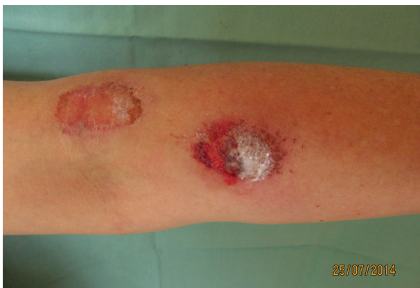
Obr. 1b) U levé loketní jamky kruhová eroze s fibrinovým povlakem, vedle hojící se eroze

nasazen hydroxyzin pro antipruriginózní a anxiolytický efekt. Pacientka byla po krátké hospitalizaci propuštěna, na plánovanou kontrolu nepřišla. V následujících letech se vždy s téměř ročními odstupy dostavovala s polymorfními stesky, kožní nález byl obdobný jako při hospitalizaci. V mezidobí byla vyšetřena na psychiatrii, nálezy s sebou nepřinesla. Podle jejího vyjádření ji tam „zničily prášky“. Při poslední dermatologické kontrole v roce 2014 byla pacientka v invalidním důchodu z psychiatrické indikace. Na předloktích se nacházely lineární exkoriace (obr. 1a), u levého lokte a na pravém nártu okrouhlé erodované plochy s fibrinovým povlakem (obr. 1b). Dále byly přítomny drobnější exkoriované plochy různého stáří na pravém stehně a bérkách. Léze byly zjevně způsobené arteficiálně. Od ošetřujícího psychiatra bylo zjištěno, že je pacientka léčena pro histrionskou poruchu a trvalou poruchu s bludy. Nedodržovala stanovenou léčbu – midazolam (hypnotikum), olanzapin, quetiapin (antipsychotika) a mirtazapin (antidepresivum). Pacientka špatně spolupracovala, nedocházela na kontroly, hospitalizaci na psychiatrickém oddělení opakovaně odmítla. Dva roky od prvního vyšetření spáchala sebevraždu skokem pod vlak.