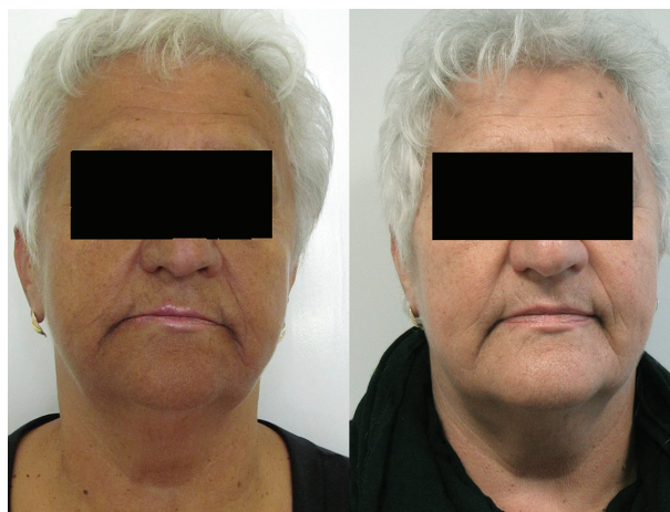
Obr. 3a, b. Před terapií (a) a po osmi měsících terapie (b)

Na základě laboratorních vyšetření bylo vysloveno podezření na Addisonovu nemoc – moč za 24 hodin 4 000 ml, volný močový kortizol 40 nmol/den (hraničně snížená hodnota), ranní kortizol v séru 203 nmol/l (85–618 nmol/l), S-ACTH: > 2 000 ng/l (norma laboratoře 5–60 ng/l), glykémie 5,2 mmol/l, v normě – renální a jaterní parametry a také mineralogram, který svědčil spíše pro pozvolný rozvoj kliniky a adaptaci organismu. Následně byla rozšířena vyšetření k odhalení příčiny. Ultrasonografické vyšetření břicha a retroperitonea popsalo cystu levé ledviny, vyšetření břicha