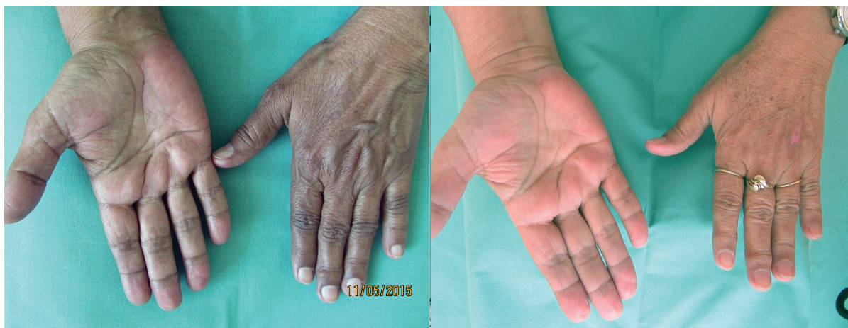
Obr. 4a, b. Před terapií (a) a po osmi měsících terapie (b)

závažný stav – addisonskou krizi – vyvolanou infektem močových cest. Vzhledem k již známé základní diagnóze byla pacientka standardně zaléčena přechodným zvýšením dávek hydrokortizonu podávaných parenterálně a antibiotiky.