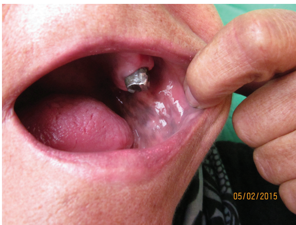
Obr. 1. Postižení sliznice dutiny ústní

i sourozenci a děti. V poslední době nepozorovala změny na kůži či sliznicích, ke stomatologovi chodí na kontroly pravidelně 2krát ročně. Cítí se dobře, sportuje a nemá žádné subjektivní potíže, nemá změnu výkonnosti, nebývá nemocná. Léková anamnéza i po cílených dotazech beze změn. Při důslednější aspekci bylo shledáno bronzové zbarvení celého kožního povrchu s intenzivnějším hnědým nádechem v solárních predilekcích a v oblastech nad kolena, lokty, v kožních záhybech a v papilárních liniích dlaní. Nehty, nehtová lůžka a jizvy byly bez patologického nálezu (obr. 3, 4).