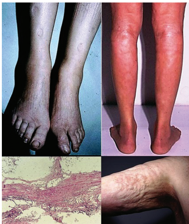
Obr. 6. Eozinofilní fasciitida – „dolíčkování“ kožního povrchu

Generalizované formy a eozinofilní fascitida vstupují do diferenciální diagnózy se systémovou sklerózou, která většinou klinicky nečiní obtíže. LS, na rozdíl od systémové sklerózy, zpravidla nepostihuje symetricky ruce, nohy, vynechává podkolení a loketní jamky, oblast axil, hlavu, krk, areoly, nevykazuje kapilaroskopické změny kapilár proximálních nehtových valů, přítomnost teleangiektazií, typické orgánové postižení a nebývá provázena Raynaudovým fenoménem.