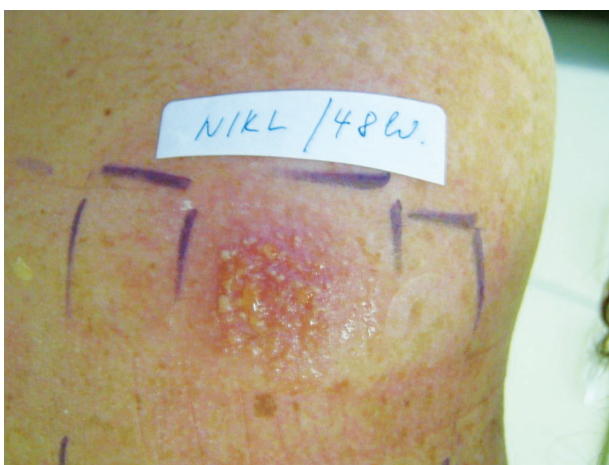
Obr. 8. Pozitivní reakce s mokráním a pustulami

Další časté reakce vznikající při epikutánních testech nepatří mezi alergické ani iritační reakce. Vyskytnout se