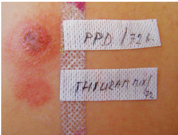
Obr. 17. Silně pozitivní reakce v epikutánním testu na parafenylendiamin a thiuram mix

bouřlivým závažným alergickým reakcím při dalším kontaktu s PPD i při ET (obr. 17).