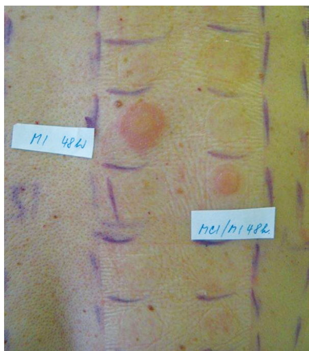
Obr. 15. Pozitivní epikutánní testy na isothiazolinony

barvy) a domácích přípravcích (přípravky na ošetřování kožených výrobků, aviváže apod.) limit není stanovený [2, 94]. Pryžové rukavice nechrání před penetrací MI [19]. Z malířských barev se uvolňuje řada týdnů (déle než 6 týdnů) a může být příčinou relapsů onemocnění [1, 49, 50]. MI byl nazván alergenem 21. století, alergenem roku 2013 v USA [91, 92] a KS na MI druhou epidemií na isothiazolinony [2, 23, 27, 78]. Kromě AKD ekzémového vzhledu (obr. 14, 15) vyvolává i kontaktní dermatitidu charakteru lymfomatoidní dermatitidy, vzhledu erytéma exsudativum multiforme, vyvolává airborne typ KD a systémovou KD (inhalací výparů) u senzibilizovaných osob včetně dětí, často zaměňovanou za recidivu atopické dermatitidy nebo lékový exantém [1, 39, 64, 97].