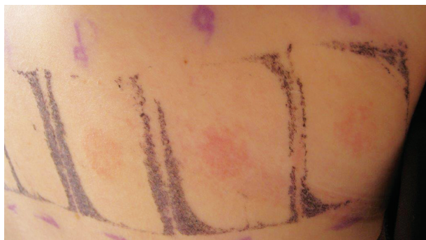
Obr. 3. Pozitivní reakce v atopických epikutánních testech

Prick-prick testy jsou modifikací klasických prick-testů. Provádí se k testování čerstvých potravin. Jsou možné 2 způsoby provedení – buď se běžnou lancetou nejprve