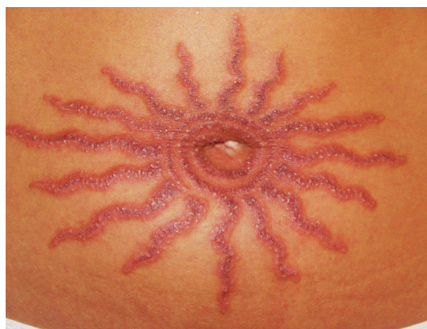
Obr. 16. Alergická reakce na parafenyldiamin po dočasné tetováží černou henou

Pro svůj silný senzibilizační potenciál je parafenyldiamin (PPD) od 30. let 20. století součástí EZS kontaktních alergenů [80]. Původně se používal k barvení textilu a kůže, nyní se používá k barvení vlasů. Pravidelně si barví vlasy více než 30 % žen a více než 10 % mužů starších 40 let, některé zdroje uvádějí i čísla podstatně vyšší [31]. PPD se smí v omezeném množství přidávat pouze do vlasových barev, maximální povolená koncentrace je 2 % PPD (v EU), v USA limit není stanovený. PPD se nesmí používat pro barvy na obočí, řasy nebo k přímé aplikaci na kůži [16]. Po obarvení kštice s barvou obsahující PPD se ekzémové projevy vyskytují spíše na vlasové hranici, na šíji a na obličejí, kde je často doprovází masivní edém kolem očí, ve kšticí často mokvají. Aktuálním zdrojem senzibilizace u dětí a dospívajících je dočasná tetováž černou henou, která se stala oblíbenou atrakcí během dovolených, zejména mimo EU (obr. 16). Obsahuje PPD v různé koncentraci (až 27,2 %) [16]. Vysoká koncentrace PPD, dlouhotrvající kontakt s kůží bez následné neutralizace a oplachu vede k silné senzibilizaci a následným