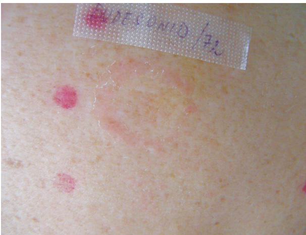
Obr. 7. Alergická reakce „edge“ charakteru