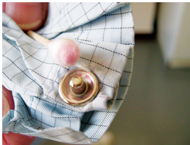
Obr. 13. Pozitivní test na přítomnost solí niklu v patentu