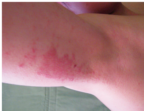
Obr. 14. Alergická kontaktní dermatitida na isothiazolinony v deodorantu

Isothiazolinony jsou organické sloučeniny, které se pro své baktericidní a fungicidní vlastnosti používají jako konzervační látky. V EU byly povolené 2 biocidy pro použití v kosmetice, methylchloroisothiazolinon (MCI) a methylisothiazolinon (MI). Směs MCI/MI v poměru 3 : 1 (Kathon CG) byla zavedená v 80. letech 20. století a široce se používala jako účinný širokospektrý konzervační prostředek [10]. To vedlo k epidemii AKD v Evropě, zjištěná KS se pohybovala mezi 3–8 % [35]. Došlo proto k postupnému snižování povolené koncentrace v kosmetických přípravcích (ze 100 ppm na 15 ppm) a od 16. dubna 2016 je použití MCI/MI v kosmetických přípravcích typu „leave-on“ zcela zakázáno [2]. V průmyslových kapalinách (např. lepidla, detergenty, oleje, malířské barvy, apod.) se stále používá v koncentracích mezi 15–50 ppm [36]. Pro nárůst KS na směs MCI/MI se od roku 2005 začal používat v kosmetických a průmyslových přípravcích výhradně nehalogenovaný derivát MI, jehož konzervační vlastnosti jsou nižší. Používané koncentrace proto byly vyšší než 100 ppm, a to ve všech typech kosmetických výrobků a řadě průmyslových výrobků [92]. Předpokládalo se, že se jedná o bezpečnou koncentraci [24]. S masivním používáním celosvětově prudce stoupla KS na MI [5]. Aktuálně je koncentrace ve všech kosmetických přípravcích omezená na 100 ppm, v průmyslových výrobcích (např. malířské