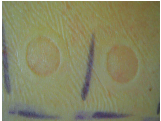
Obr. 9. Tlaková reakce po sejmutí testovacích náplastí