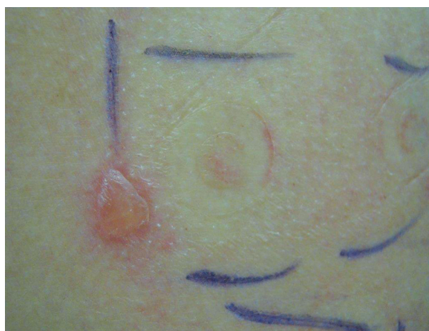
Obr. 10. Tahová reakce charakteru puchýře u okraje testovací náplasti

niklu, mědi, chromu, zlata) – obrázek 8. Může jít o zesílenou odpověď způsobenou chemotaxí neutrofilních leukocytů. Pustula může překrývat alergickou reakci, proto v nejasných případech je třeba testy zopakovat s nižší koncentrací alergenu [45, 66, 99].