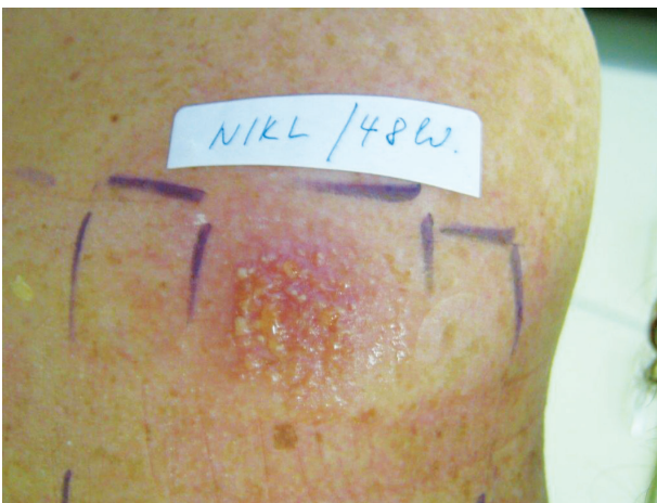
Obr. 8. Pozitivní reakce s mokráním a pustulami

Další časté reakce vznikající při epikutánních testech nepatří mezi alergické ani iritační reakce. Vyskytnout se