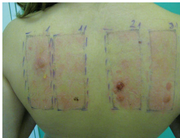
Obr. 11. Syndrom rozhněvaných zad