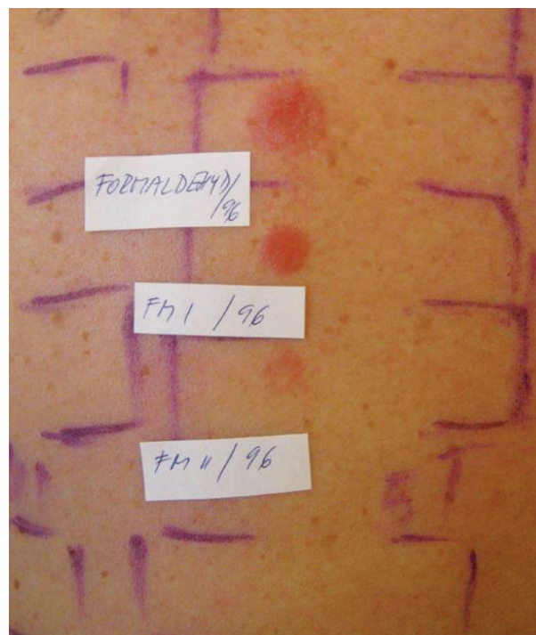
Obr. 5. Alergické reakce v epikutánních testech (sestupně +++ silná, ++ střední, + mírná intenzita)

Iritační reakce v ET mohou mít různou morfologii. Klasická iritační reakce má monomorfní vzhled, je ohraničená na místo aplikace a maxima dosahuje první odečítací den (D2). Během dalších hodnocení reakce zeslabuje (tzv. „decrecendo“ fenomén) nebo zcela vymizí. Příčinami bývají nevhodná koncentrace, zvýšená dráždivost kůže a další faktory. Některé iritační reakce mají charakteristický obraz: Mýdlový (šamponový) efekt (obr. 6) vyvolávají mýdla, mycí, čistící prostředky, detergenty a alkalické látky i v dostatečném ředění při prvním odečtu