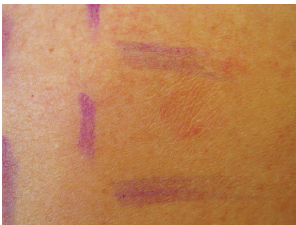
Obr. 6. Mýdlový efekt