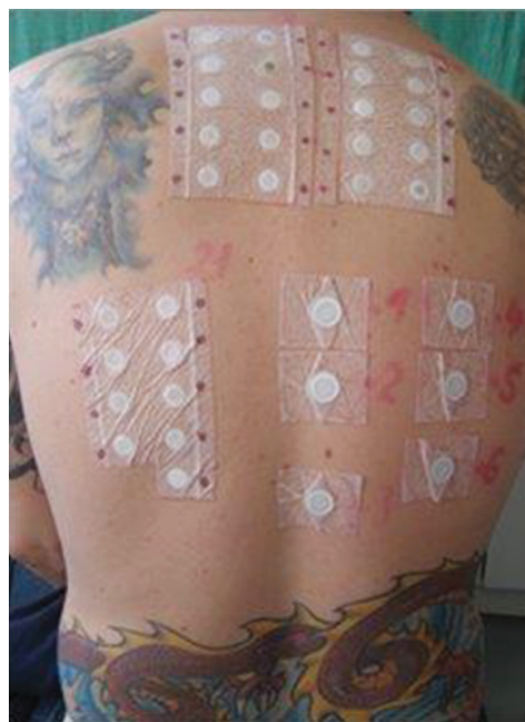
Obr. 1. Uzavřené epikutánní testy – evropská základní sada a atopické epikutánní testy