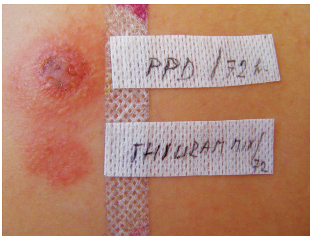
Obr. 17. Silně pozitivní reakce v epikutánním testu na parafenylendiamin a thiuram mix

bouřlivým závažným alergickým reakcím při dalším kontaktu s PPD i při ET (obr. 17).