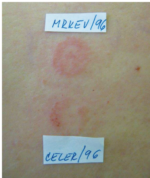
Obr. 4. Pozitivní kožní test s potravinami (SAFT)

„píchně“ do čerstvé potraviny a poté se malé množství potraviny stejnou lancetou aplikuje do kůže. Druhý způsob je aplikace do kůže přes čerstvou potravinu položenou na kůži, poté se potravina z kůže odstraní. Odečty se provádějí po 30 minutách a poté jako u uzavřených ET [25, 30, 32].