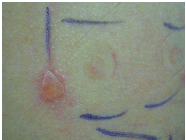
Obr. 10. Tahová reakce charakteru puchýře u okraje testovací náplasti

niklu, mědi, chromu, zlata) – obrázek 8. Může jít o zesílenou odpověď způsobenou chemotaxí neutrofilních leukocytů. Pustula může překrývat alergickou reakci, proto v nejasných případech je třeba testy zopakovat s nižší koncentrací alergenu [45, 66, 99].