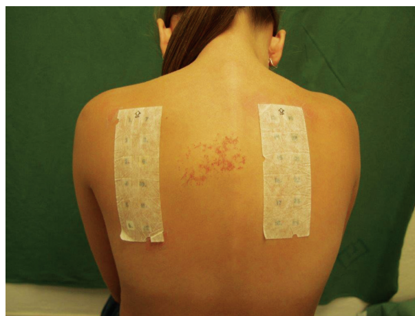
Obr. 2. Epikutánní testy T.R.U.E

Kromě EZS je možné si objednat speciální sady standardizovaných alergenů. K dispozici jsou sady zaměřené na určitou profesi (např. kadeřníci, obráběči kovů, pekaři apod.), na určité specifické podezříváné alergeny (např. sady lékové, sady zubních alergenů, kosmetických alergenů, chemikálií pryže, fotokontaktních alergenů apod.). K testování lze použít sady kontaktní alergenů od firem Chemotechnique Diagnostics ( www.chemotechnique.se ), AllergEASE ( www.smartpracticecanada.com ) nebo tzv. T.R.U.E testy ( www.smartpracticecanada.com ). T.R.U.E test (Thin-layer Rapid Use Epicutaneous test) je speciální testovací systém, u kterého je přesně stanovené množství alergenů (v miligramech na cm 2 ) vpravené