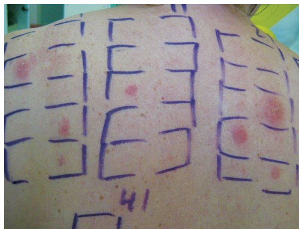
Obr. 12. Polyvalentní kontaktní senzibilizace