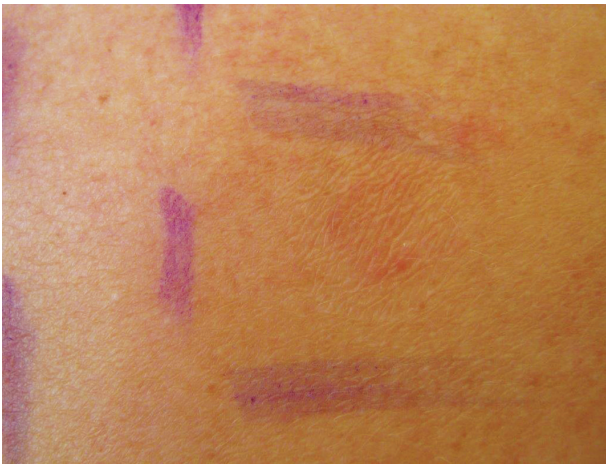
Obr. 6. Mýdlový efekt