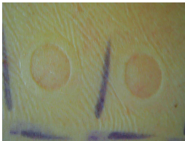
Obr. 9. Tlaková reakce po sejmutí testovacích náplastí