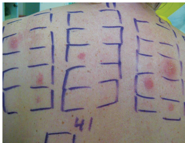
Obr. 12. Polyvalentní kontaktní senzibilizace