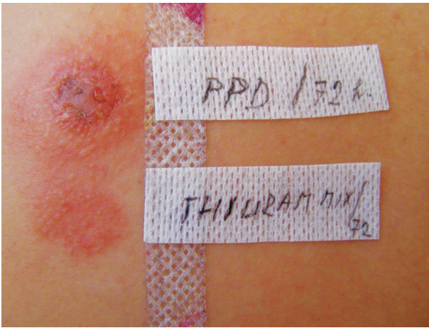
Obr. 17. Silně pozitivní reakce v epikutánním testu na parafenylendiamin a thiuram mix

bouřlivým závažným alergickým reakcím při dalším kontaktu s PPD i při ET (obr. 17).