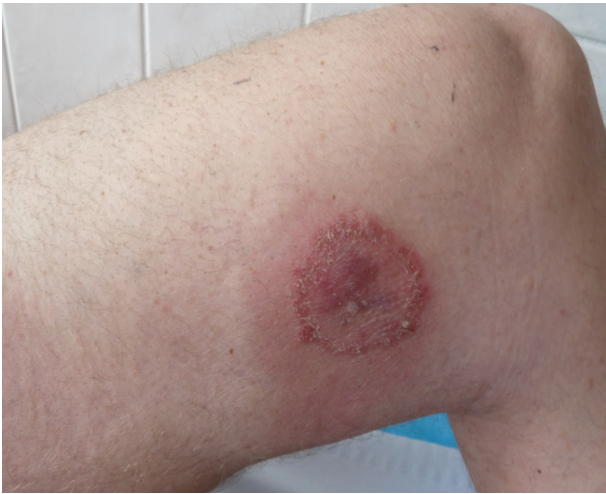
Obr. 2. Anulární ložisko s vyvýšeným okrajem

liv kontakt s infekčním onemocněním či zvířaty. Pacient byl nezaměstnaný a žil sám v nájemním bytě.