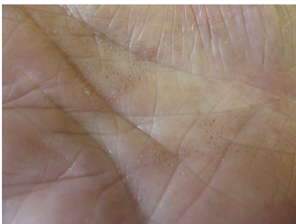
Obr. 4. Porokeratosis punctata palmaris et plantaris