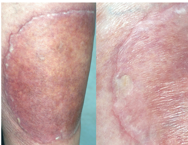
Obr. 3. Porokeratosis Mibelli gigantea V detailu s patrným tzv. periferním vláskovým lemem a atrofií kůže centrálně.