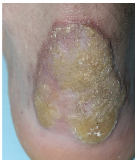
Obr. 2. Porokeratosis Mibelli

PM, první popsaná PK, patří k druhé nejčastější formě s vyšším výskytem v mužské populaci [87]. Často se objevuje již v dětském věku. Začíná jako asymptomatická nebo mírně svědivá eflorescence, která se pomalu v průběhu let zvětšuje. Centrum bývá hypopigmentované nebo hyperpigmentované, atrofické, mírně se šupící, bez přítomnosti ochlupení (obr. 2). Někdy léze dosahují velikosti až 20 cm a tato forma je pak označována jako PM gigantea (obr. 3, 4). Některými autory je PM gigantea dokonce považována za samostatnou formu PK [41]. A může se vyskytnout současně s psoriázou [20]. PM je obvykle lokalizovaná unilaterálně na končetinách, někdy i na dlaních a ploskách, ve křtici, na genitálu či na rtu nebo na sliznici dutiny ústní. Při lokalizaci na prstu může projev zasahovat i nehtový aparát a způsobit pterygium [47, 62].