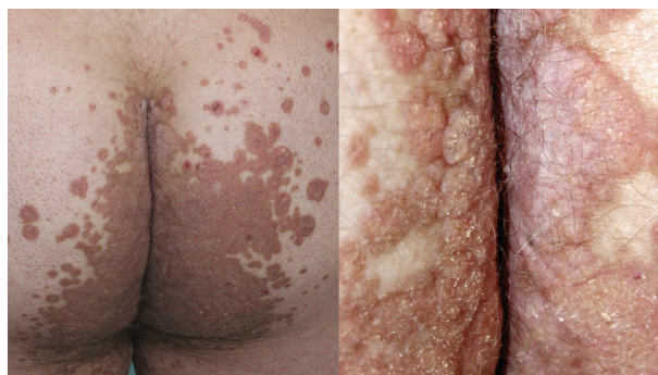
Obr. 5. Porokeratosis ptychotropica

PPPP je velmi vzácná forma PK, kterou poprvé popsal Brown v roce 1971 [12]. Označuje se také jako palmo-plantární keratodermie, punktátní typ II (PPKP2) [93]. Objevuje se obvykle po pubertě a v dospělosti. Projev dosahují velikosti pouze 1–4 mm, jsou mnohočetné a lokalizované na dlaních a chodidlech. Jednotlivé eflores-