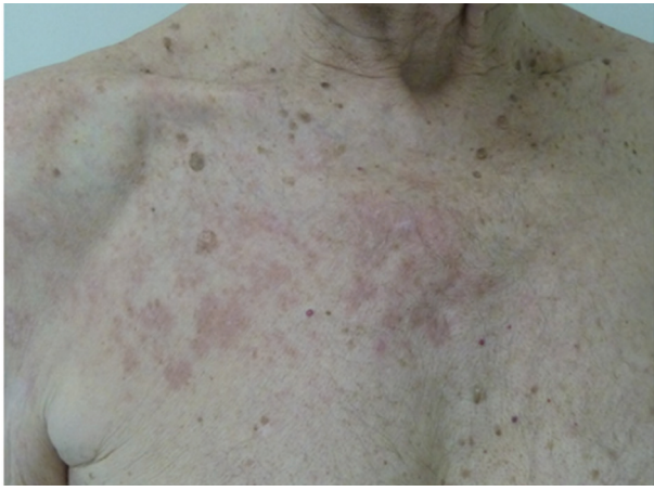
Obr. 1. Granuloma anulare v místě předchozího pásového oparu