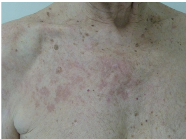
Obr. 1. Granuloma anulare v místě předchozího pásového oparu