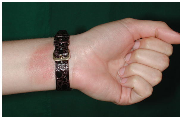
Obr. 7. Alergická kontaktní dermatitida na soli niklu

Projevy AKD korespondují s místem kontaktu alergenu s kůží (primární lokalizace), bývají nejčastěji na