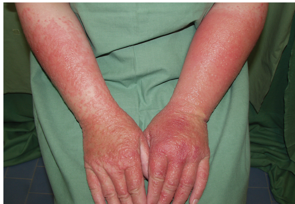
Obr. 8. Alergická kontaktní dermatitida po ketoprofenu