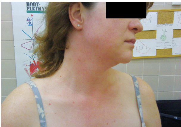
Obr. 5. Snímek erytému na krku a v obličeji po provedení expozičního testu