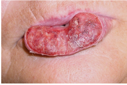
Obr. 4. Exofytický rostoucí rozsáhlý spinocelulární karcinom dolního rtu (T3) indikovaný k radikální resekcii a rekonstrukci pomocí místních posunů tkání (operace podle Szymanowského)

statisticky významné zvýšení počtu metastáz již u nádorů větších než 15 mm [9].