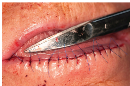
Obr. 7. Sutura rány po celkové excizi retní červeně („lip shaving“) dolního rtu

Spinocelulární karcinom dolního rtu je onemocnění vyskytující se především ve starší populaci. Má poměrně dobrou prognózu. Včasný záchyt spojený s menším rizikem komplikací, lepším estetickým výsledkem (obr. 7, 8, 9) a velkou šancí na úspěšnou léčbu přitom nebývá problematickým vzhledem k tomu, že pacienti obvykle sami vyhledávají odbornou pomoc, neboť nádor je na velmi viditelném místě. Je však nutné onemocnění včas rozpoznat a pacienta odeslat k řešení na vhodné onkologické nebo chirurgické pracoviště s dostatečnými zkušenostmi s daným typem nádoru (vhodné je např. pracoviště ma-