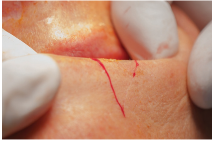
Obr. 5. Naznačení klínovité excize dolního rtu vlevo

některého z rekonstrukčních postupů (např. podle Szymanowského, Karapandzice, Gilliese...) – obr. 7–9. Nutná je opět velmi pečlivá sutura. Tyto operační techniky lze kombinovat, kvadratickou excizi je možno doplnit o resekci retní červeně. U rozsáhlých tumorů prorůstajících do kosti resekujeme kromě měkkých tkání i postižené kosti [18].