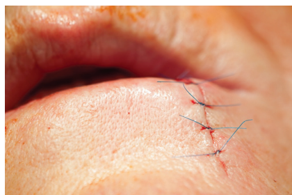
Obr. 8. Sutura rány po klínovité excizi dolního rtu