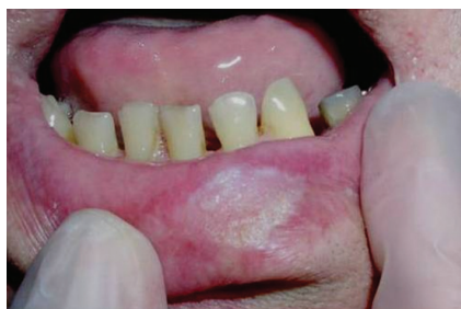
Obr. 1. Spinocelulární karcinom dolního rtu (T1) připomínající hyperkeratózu dolního rtu

Prognóza SCK rtu je relativně dobrá díky jeho viditelnosti a včasnému záchytu (pacientovi léze kosmeticky vadí, proto spíše vyhledá lékaře). Velká většina nádorů je zachycena ve fázi T1N0M0 nebo T2N0M0. Pětileté relativní přežití (tedy po vztažení přežívání pacientů s SCK na přežívání srovnatelné skupiny bez diagnózy SCK) pro tyto časné fáze se v literatuře udává v intervalu 85–99 % [16, 31, 35, 38]. Metastázy na krku se u pacientů s SCK dolního rtu objevují podle různých studií ve 3–29 % případů [16, 26, 36] a v případě jejich výskytu je prognóza výrazně horší – pětileté přežití se udává jen v 25–50 % [1, 36, 41]. Výskyt metastáz souvisí především s velikostí a tloušťkou primárního tumoru a stupněm diferenciací (dobře diferencované nádory mají menší množství metastáz než nediferencované). Častější výskyt metastáz je spojen s rekurentními nádory [16, 26, 41]. Jako hranice, za kterou je již vznik krčních metastáz velmi pravděpodobný, se udává tloušťka nádoru 5 mm [30], případně velikost nádoru 3 cm [41]. Některé studie však detekovaly