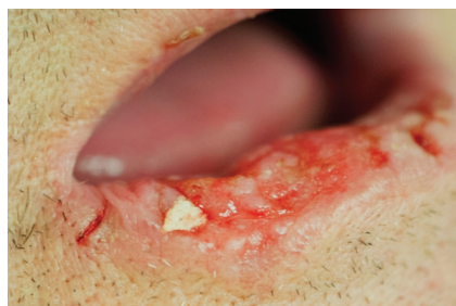
Obr. 2. Erozivní forma spinocelulárního karcinomu dolního rtu (T2) indikovaného ke kvadratické excizi