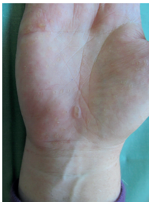
Obr. 1a, b. Hyperkeratotické papule

du 2011 musela být ukončena pro komplikace – cheilitis sicca a zvýšení transamináz. Opakované histologické vyšetření v roce 2012 popsalo vkleslinu kožního povrchu o průměru 3 mm vyplněnou hyperkeratotickým čepem, na spodině mírně akantotickou epidermis (obr. 2). Tento histologický nález odpovídal klinické diagnóze punktátní keratodermie. Při hospitalizaci na kožním oddělení v roce 2014 byl nasazen lokální isotretinoin a vazelína s 10 % salicylové kyseliny, po kterých se kožní nález podstatně zlepšil. Tato léčba pokračuje spolu s pravidelnou pedikérou péčí – obrušováním frézou, změkčováním