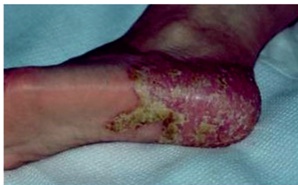
Obr. 4. Chronický erytém s deskvamací a ragádami u chronického průběhu PPP

tulózy, i když popisovány jsou i kožní projevy charakteru chronické ložiskové psoriázy nebo psoriaziformních exantémů. Podstata této vzácné komplikace není zatím přesně objasněna. Pravděpodobná je hypotéza, že náhlá a intenzivní blokáda TNF alfa vede k zesílení aktivity INF alfa s následnou indukcí psoriázy [7, 22, 25].