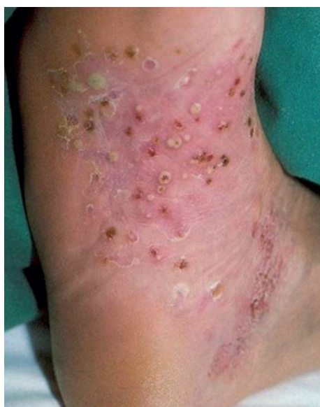
Obr. 3. Typický výsev sterilních pustulí

Psoriasis pustulosa palmoplantaris Barber (PPP) představuje chronickou zánětlivou, terapeuticky značně rezistentní dermatózu, postihující o něco častěji ženy než muže v poměru 2 : 1. Pozorována je asociace s kouřením, které patří k důležitým provokačním faktorům. PPP je poměrně kontroverzní jednotkou, jejíž vztah k psoriáze je dnes některými autory zpochybňován, a to i přesto, že asi ve 20 % případů je asociována s klasickými příznaky psoriasis vulgaris [2, 5, 11, 18]. V novějších textech je palmoplantární pustulózní psoriáza vyčleňována jako samostatné onemocnění [5, 8, 11, 18]. Důvodem je odlišný genetický profil s absencí vazby na lokusy HLA typické pro psoriázu a zároveň i rozdílná odezva na terapii, signalizující pravděpodobně odlišné etiopatogenetické pochody vedoucí ke klinické manifestaci choroby [1, 2, 18]. Příkladem je zpravidla špatná terapeutická odezva palmoplantární pustulózy na léčbu inhibitory TNF alfa nebo vznik paradoxních kožních reakcí popisovaných u některých pacientů s autoimunitním onemocněním (revmatoidní artritida, ankylozující spondylitida, psoriáza a psoriatická artritida, Crohnova choroba, ulcerózní kolitida) v průběhu terapie těmito preparáty [7, 22, 25]. Tyto paradoxní reakce mají velmi často charakter palmoplantární pus-