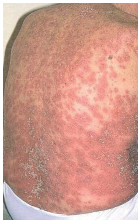
Obr. 2. Generalizovaná pustulózní psoriáza

Klinický obraz je zpravidla dosti bouřlivý. Febrilie a celková zchvácenost v úvodu jsou následovány výsevy živě červených postupně splývajících makul. Na zánětlivé spodině dochází k různě intenzivní tvorbě pustul (obr. 2). Projevy se postupně šíří po celém těle a někdy i na sliznice dutiny ústní [10, 11]. Nové pustulózní výsevy jsou provázeny subfebriliemi. Při dlouhodoběji přetrvávajícím neléčeném či terapeuticky nezvládnutém stavu se může rozvinout elektrolytová a proteinová dysbalance. Pacienti mají zvýšený sklon k rozvoji bakteriálních infekcí. Laboratorně je signifikantní elevace zánětlivých markerů (sedimentace, CRP, leukocytóza), hypokalcémie a hypoalbuminémie. V diferenciální diagnóze je nutné odlišit zejména GPP bez asociace s LP od akutní generalizované exantematické pustulózy (AGEP), jejíž etiologie je poléková a na rozdíl od psoriázy von Zumbusch poměrně rychle regreduje bez recidiv [11]. V individuálních přípa-