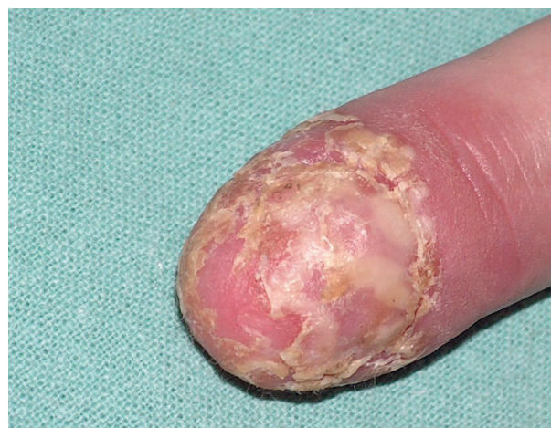
Obr. 5. Acrodermatitis continua suppurativa (Hallopeau)

Acrodermatitis continua suppurativa (Hallopeau) je považována za variantu pustulózní psoriázy omezenou na oblast distálních falangů, často sdruženou s destruktivními přílehlých kostních struktur [4, 8, 11]. Onemocnění