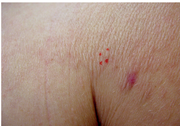
Obr. 2. Hranice postižené kůže s jizvou po předchozí biopsii a označením biopsie opakované