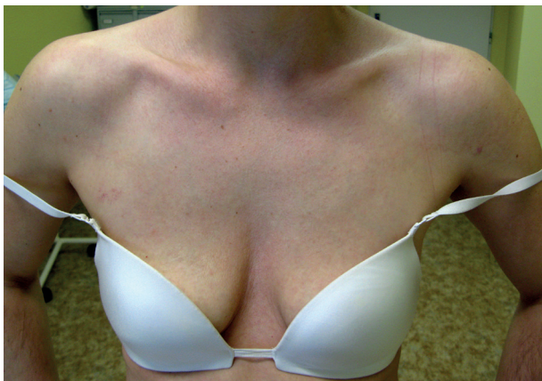
Obr. 1. Plocha svráštělé kůže postihující celý výstřih a horní partii hrudníku