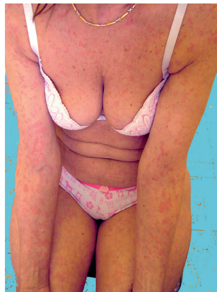
Obr. 3. Schnitzlerové syndrom s urtikariálním výsevem

Toto vzácné onemocnění s neznámou etiologií je charakteristické recidivujícími urtikariálními projevy doprovázenými intermitentně záchvaty horečky, bolestí kostí a kloubů a monoklonální IgM gamapatií. Řadí se v klasifikaci chronických urtikárií mezi tzv. neutrofilní urtikárie , resp. urtikariální syndromy, jako jsou kryopyrinopatie a Stillova choroba [17]. Kožní projevy jsou asymptomatické – nesvědčí, nebolí a nejsou doprovázeny angioedémem. Současně bývá přítomna lymfadenopatie a hepatopatie, laboratorně je zvýšená sedimentace erytrocytů a CRP. Až ve 20 % se může objevit lymfoproliferativní onemocnění a vzácně závažná anémie a trombofilie. Histologicky se zjistí perivaskulární infiltrát sestávající