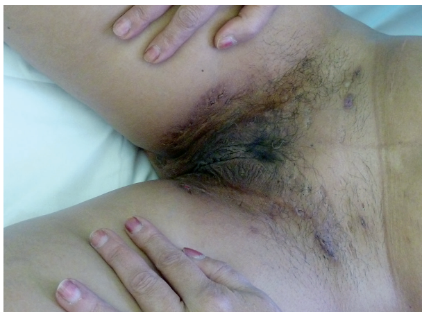
Obr. 6. Hidrosadenitis suppurativa v třísllech u téže pacientky

Tento autoinflamatorní syndrom patří mezi zcela nově popsané autoinflamatorní onemocnění, a to v roce 2012 Braun-Falcm, jr. Liší se od PAPA syndromu absencí epizod pyogenní artritidy. Pacienti mají acne conglobata a hidrosadenitis suppurativa , v těchto lokalitách může následně vzniknout pyoderma gangrenosum [3] – obr. 6, 7. Tyto syndromy se mohou různě sdružovat s dalšími nemocemi, takže se hovoří už o dalších nových akronymech: PAPASH (PASH a pyogenní arthritis), PsAPASH (psoriatická artritida a PASH) [Růžička T.: Autoinflama-