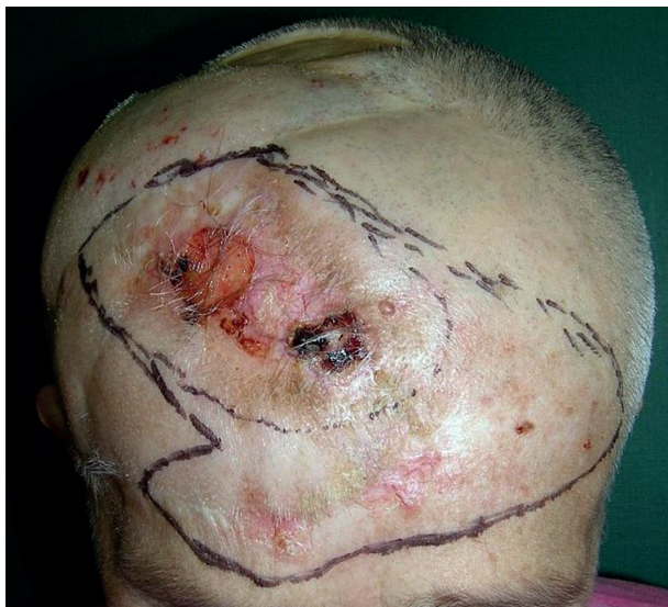
Obr. 1a. Recidiva bazaliomu na hlavě před operací v roce 2008