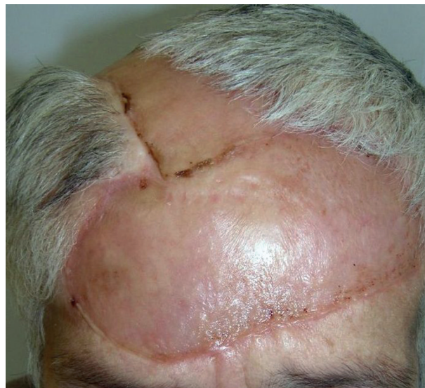
Obr. 1b. Stav po operaci

Laboratorní vyšetření před zahájením léčby (krevní obraz a základní biochemická vyšetření) byla normální. Kontrolní vyšetření jsme pak prováděli opakovaně v průběhu léčby a výsledky byly vždy v normě.