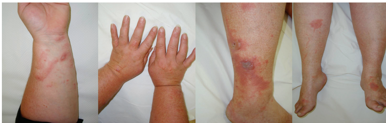
Obr. 9. 52letá žena – 48 hodin po sklizení nati libečku (červenec)

V některých případech se mohou objevit jen pigmentace bez předchozího zjevného zánětlivého stadia. Klinické projevy odpovídají činnosti, při které se pacienti rostlinám či jejich extraktům exponovali. Ležení v trávě – meadow dermatitis, sekání travin kosou – dlouhé stvolky vytvářejí lineární či angulární linie s erytémem, vezikulami a bulami, při užívání mechanizace – sekačky (z kratších stvolů rostlin drobné bizarní léze – weed-eaton dermatitis), projevy poněkud rozdílného charakteru pak vznikají při použití strunové sekačky či elektrických nůžek na rostliny (trimmer derma-