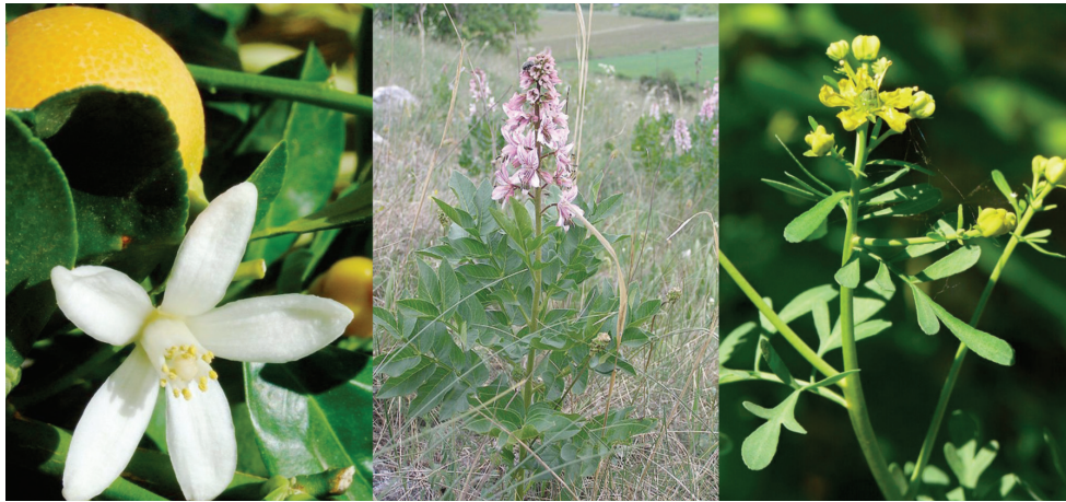
Obr. 3. Rutaceae (zleva: Citrus sinensis , Dictamnus albus , Ruta graveolens )

ní době. Ke zvýšení jejich obsahu může docházet vlivem stresu – napadení mikroorganismy, hmyzem, mechanickým poškozením, nevhodným klimatem a skladováním za nízkých teplot [7, 35, 49]. Jejich akční spektrum se nachází v rozmezí od 290 do 407 nm, s maximem nad 320 nm. Fotoreaktivita látek se mění podle substituce vodíkových atomů na molekule jednotlivých sloučenin methylovými, methoxylovými, hydroxylovými nebo dalšími radikály. Výraznější fototoxický efekt mají lineární psoraleny oproti angulárním. Nejsilnější fototoxický účinek pak má 5-methoxy-psoralen (5-MOP, bergapten) a 8-methoxypsoralen (8-MOP, xantotoxin) [29, 33, 35]. Polyacetyleny a deriváty thiofenu byly izolovány u čeledi Asteraceae (hvězdnicovité), ale fototoxické reakce nebyly publikačně zaznamenány, především asi proto, že tyto sloučeniny nebyly na kůži v dostatečně vysoké koncentraci či nepenetrovaly přes stratum corneum [8, 35]. Zástupci této čeledi jsou zejména zodpovědní za kontaktní alergické reakce prostřednictvím seskviterpenických laktonů [1, 33, 35].