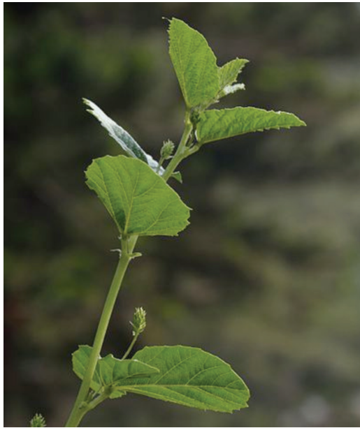
Obr. 6. Fabaceae (Psoralea corylifolia)