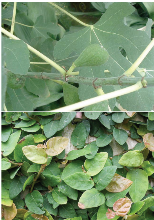
Obr. 7. Moraceae (zleva: Ficus carica, Ficus pumila)

se vyskytují v tropech a subtropích. Jsou široce rozšířené jako okrasné rostliny, fíkovník smokvoň (Ficus carica) je pěstován pro plody [43] – obrázek 7. Má vysoký obsah furokumarinů (psoralen, bergapten) v listech a výhoncích, ale nikoliv v plodech. Vyšší obsah fotoaktivních látek je na jaře a v časném létě [53]. V některých zemích je čaj z fíkovníkových listů hojně užívaný k získání „perfect tan“ jako akcelerátor opálení s maximem účinku za 24 hodin. V Turecku byl zaznamenán případ ženy s popáleninami 81 % povrchu těla po požití tohoto přípravku, v Brazílii bylo několika nemocnicemi hlášeno v jednom letním období 50 případů popálenin indukovaných fíkovými listy [46]. Fíkovník šplhavý (Ficus pumila) se vyskytuje přirozeně v Číně, Japonsku a na Taiwanu, ale jeho kultivary se nalézají i v jiných místech světa, jako okrasná rostlina je používán k vertikálnímu porůstání stěn či do živých plotů (Nový Zéland, Austrálie). V tradiční medicíně se užívá latexu z fíkov-