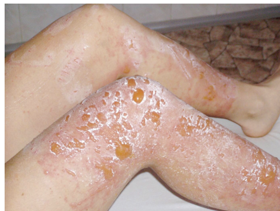
Obr. 8. 17letá žena – 48 hodin po kontaktu s pastinákem Výpomoc při sklizni v rodině zabývající se zelinářstvím (srpen).

se vyskytují v tropech a subtropích. Jsou široce rozšířené jako okrasné rostliny, fíkovník smokvoň (Ficus carica) je pěstován pro plody [43] – obrázek 7. Má vysoký obsah furokumarinů (psoralen, bergapten) v listech a výhoncích, ale nikoliv v plodech. Vyšší obsah fotoaktivních látek je na jaře a v časném létě [53]. V některých zemích je čaj z fíkovníkových listů hojně užívaný k získání „perfect tan“ jako akcelerátor opálení s maximem účinku za 24 hodin. V Turecku byl zaznamenán případ ženy s popáleninami 81 % povrchu těla po požití tohoto přípravku, v Brazílii bylo několika nemocnicemi hlášeno v jednom letním období 50 případů popálenin indukovaných fíkovými listy [46]. Fíkovník šplhavý (Ficus pumila) se vyskytuje přirozeně v Číně, Japonsku a na Taiwanu, ale jeho kultivary se nalézají i v jiných místech světa, jako okrasná rostlina je používán k vertikálnímu porůstání stěn či do živých plotů (Nový Zéland, Austrálie). V tradiční medicíně se užívá latexu z fíkov-