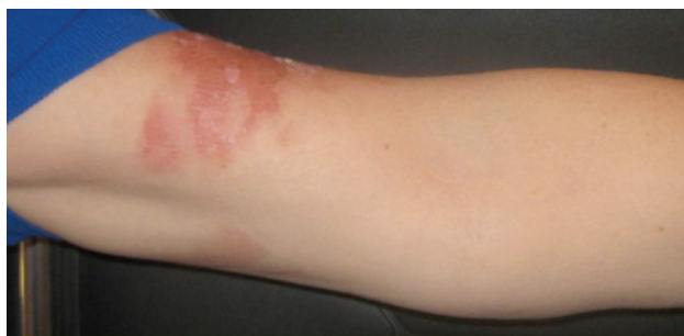
Obr. 4. Účastnice kongresu AAD Miami (duben) – 72 hodin po kontaktu se šťávou z limetky

Jde o divoce rostoucí i ušlechtilé byliny s typickým květenstvím – okolík (jednoduchý či složený) – obrázek 5. Obsahují významné množství furanokumarinů. Nejstarší využívaný zástupce pro fototoxické účinky je Morač větší, syn. Pakmín větší ( Ammi majus , false Bishop's weed).