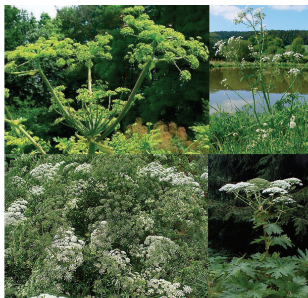
Obr. 5. Apiaceae (shora: Angelica archangelica , Anthriscus sylvestris Ammi maius , Heracleum mantegazzianum )

Nejdůležitější zástupci miříkovitých vyvolávají fototoxické reakce: