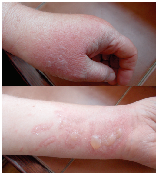
Obr. 10. 43letá žena – 72 hodin po zpracování kořenové zeleniny (říjen)

titis). Při zpracování zeleniny, bylin či přípravě potravin vždy v místě kontaktu a potřísnění (obr. 8, 9, 10). Typické obrazy jsou pak po používání kosmetik s příměsí bergamotu (parfémové kompozice ze silice Citrus bergamia – Eau de Cologne), hnědočervené pásy následující stékající tekutinu s lokalizací na obličeji, krku a výstřihu. Popsány jsou také generalizované reakce po aromaterapii s použitím bergamotového oleje [20, 47]. V případě přípravy nápojů z citrusů bývají projevy na prstech rukou, při jejich konzumaci na slunci cheilitidy a pericheilitidy. Nepostihuje místa chráněná před UV zářením oděvem, extrémním příkladem je tzv. inverse socking distribution – inverzní ponožková distribuce [52]. Postižené plochy nesvědí, pacienti udávají pálení a bolest. Pro stanovení diagnózy jsou velmi důležité anamnestické údaje, v některých případech je vhodná konzultace botaniků. Postižení bývají zejména zahrádkáři, farmáři, lesní dělníci, bylinkáři a lidé trávící volný čas v přírodě [34]. Fytofotodermatitidy mohou způsobovat profesionální postižení a měly by být také hlášeny. První literární zmínka o profesionálním postižení pochází z roku 1926 – šlo o dermatitidy po celeru u prodávачů zeleniny [30]. Onemocnění se vyskytuje spíše v pozdním létě, kdy bývá zastoupeno více UVA záření a v rostlinách je vyšší koncentrace psoralenů [27, 35, 38, 43]. Je také častější v subtropických a tropických oblastech pro hojnější a různorodější flóru i pro klimatické podmínky [12].