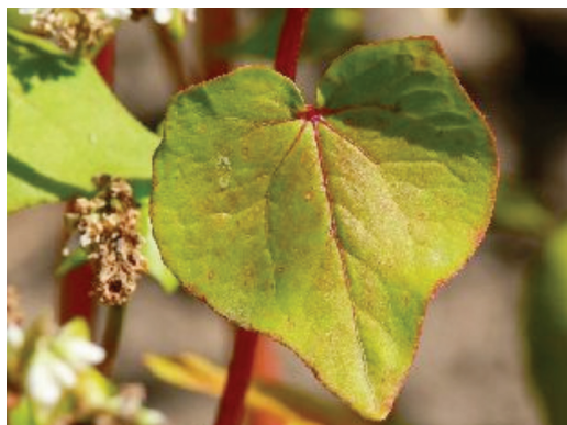
Obr. 1. Polygonaceae ( Fagopyrum esculentum )

Mezi nejvýznamnější látky s výraznými fototoxickými účinky patří skupina furokumarinů (furanokumarinů), dále to jsou naftodianthrony, polyacetyleny a deriváty thiofenu, feoforbidy v řasách ( Chlorella ) [1, 8, 35] – tabulka 1-2. Furanokumariny jsou toxické sekundární metabolity rostlin především čeledi Umbelliferae (syn. Apiaceae) – okoličnaté, Rutaceae – routovité, Moraceae – morušovníkovité, Fabaceae – bobovité, vzácněji jiných druhů (Asteraceae, Ranunculaceae, Hypericaceae, Anacardiaceae, Convolvulaceae) [8, 35, 49]. Pro své biologické účinky se řadí mezi přírodní toxiny (fytoalexiny). Chemicky jsou to deriváty kumarinů a podle struktury se dělí na lineární (psoralenový typ) a an-