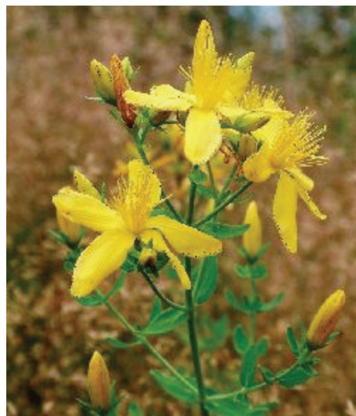
Obr. 2. Hypericeae ( Hypericum perforatum )

gulární (angelicinový typ). Jejich fyziologickou funkcí v rostlinách je ochrana před plísňovými infekcemi. Jsou termostabilní a mimo fototoxického efektu byla u zvířat prokázána mutagenita a kancerogenita. Množství furokumarinů v rostlinách závisí na růstovém období, místu výskytu a roč-