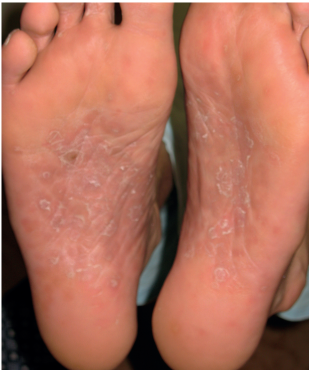
Obr. 3. Makulopapulózní exantém na chodidlech

Při přijetí v objektivním nálezu dominoval generalizovaný makulózní exantém a celkové ikterické zbarvení kůže a sklér (obr. 1). V oblasti obličeje kolem úst a také ve dlaních a na chodidlech měly kožní projevy makulopapulózní charakter (obr. 2, 3). Disperzně na integumentu byly přítomny drobné eroze a exkoriace, které byly důsledkem generalizovaného pruritu. V obou tříslích byly výrazně zvětšené nebolestivé uzliny a současně přetrvávaly výše uvedené subjektivní potíže a subfebrilie. Pacient byl astenického habitu s aktuálním BMI (Body Mass Index) 18,2.