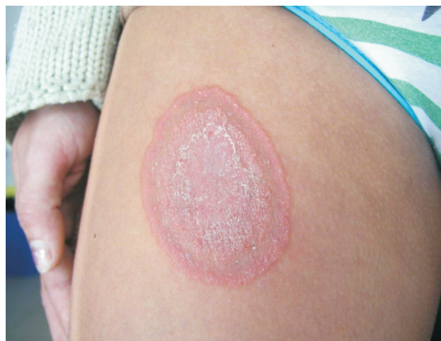
Obr. 3. Tinea corporis způsobená A. benhamiae u mladé ženy. Na stehně přidržovala morče při střihání.

Klinicky je pro zástupce rodu Microsporum typické napadení vlasu typu ektotrix, vlas se ulamuje, ložiska jsou okrouhlá, vícečetná, v okolí je patrný zánět (tinea capitis microsporica). Projevy vyvolané antropofilními dermatofyty rodu Trichophyton (tinea capitis trichophytica) jsou podobné, ložiska jsou drobnější, neostře ohraničená. Infekce může být typu ektotrix i endotrix. Zoofilní druhy způsobují silnější zánětlivou reakci, infekce může pronikat do vlasových folikulů, vytvářejí se fluktuující hrboly,