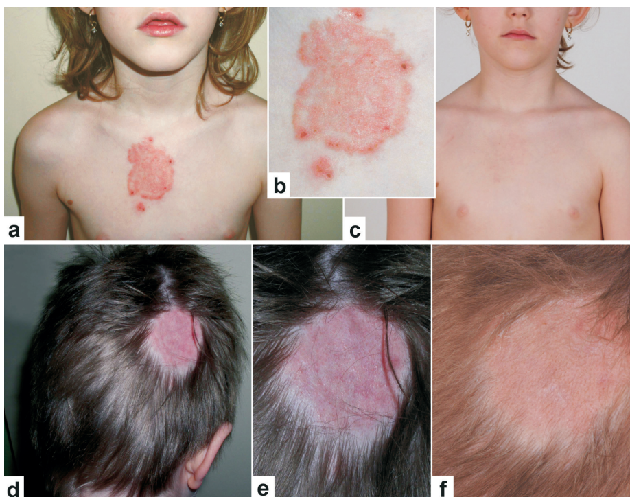
Obr. 2. Tinea corporis a tinea capitis u sourozenců Sedmiletá dívka s ložiskem na hrudi: stav při přijetí (a, b), stav po léčbě (c). Pětiletý chlapec s ložiskem alopecie: stav při přijetí (d, e), stav po léčbě (f).

Při příjmu uvedla babička (sourozenci jí byli přiděleni k opatrování soudně), že žijí společně v rodinném domě a chovají psa, morčata a slepice. První projevy infekce mohly být pozorovány již v lednu 2013. V té době se u chlapce objevil exantém na hrudi a ložisko 10 x 10 cm s nánosem žlutavých šupin ve kštici, a byl přeléčen jako scabies. O tři týdny později se u chlapce objevilo mokvavé ložisko alopecie na temeni hlavy vpravo. Také u dívky se v únoru 2013 objevilo nehojící se, zarudlé ložisko na