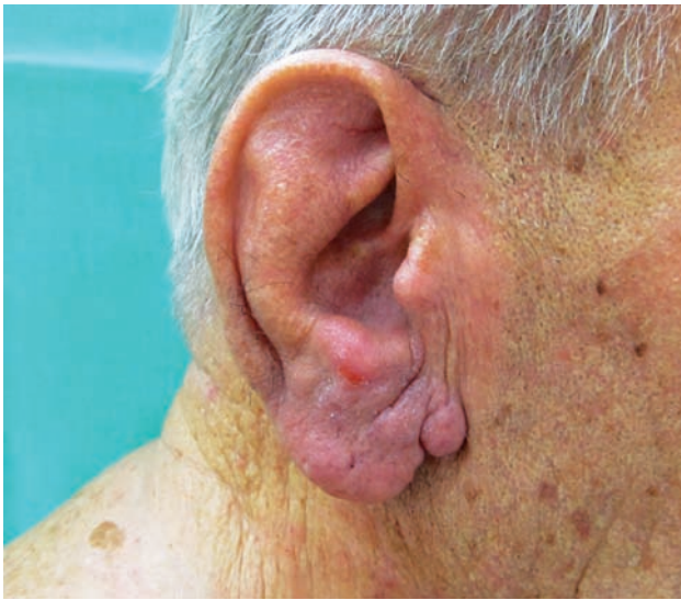
Obr. 1. Klinický obraz