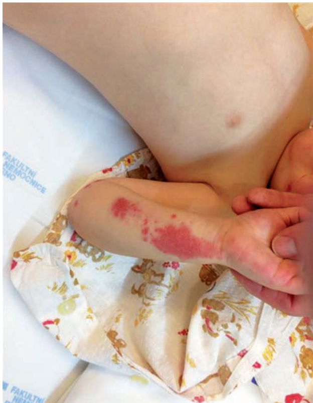
Obr. 1. Purpura v oblasti předloktí a dlaně

nález na dolních končetinách dítěte zdál rodičům intenzivnější, vyhledala rodina znovu odbornou pomoc a dítě bylo přijato k hospitalizaci. Při přijetí byla dívka v celkově dobrém stavu, adekvátně reagující, bez známek omezené hybnosti, její tělesná teplota byla 37,5 °C. Podobně jako při předchozím vyšetření v rámci LSPP vévodily klinickému nálezu u dítěte změny na kůži – v oblasti obou dolních končetin (stehna, bérce, dorza nohou) byla přítomna mírně nad niveau prominující purpura, jejíž některé morfy byly již staršího data; purpura byla velkoplošná a měla charakter ekchymóz. Dolní končetiny, zejména pak bérce, mělo dítě edematózní, otok byl tužší a byl zřetelný také perimaleolárně a na dorzu nohou. Obdobný nález purpury prová-