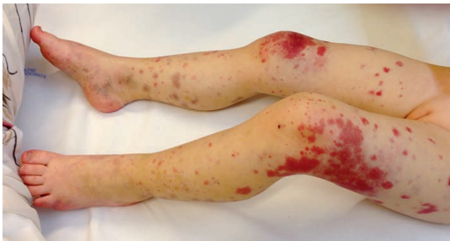
Obr. 2. Velkoplošné ekchymózy různého stáří provázené edémem bérců a dorza nohou

zené edémem měkkých tkání byl také na obou předloktích a dlaních (obr. 1 a 2). Palpace obou bérců byla provázena jen nevýraznou citlivostí dítěte, zřetelná bolestivost vyvolávající pláč nebo jinou algickou reakci nebyla přítomna. Otok v oblasti levého ušního boltce již nebyl přítomen a purpura zde již byla vybledlá. Zbývající klinické vyšetření dívky bylo se zcela normálním nálezem.