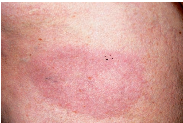
Obr. 4. Granuloma anulare – erytematózní forma (Dermatovenerologická klinika 1. LF UK a VFN)

Perforující forma GA se klinicky projevuje jako malé papuly s centrálními prohlubněmi krytými krustami nebo fokálními ulceracemi na hřbetech rukou a prstech [2, 12]. Představuje asi 5 % všech případů GA, histologicky představuje transepidermální eliminaci degenerovaného kolagenu [2].