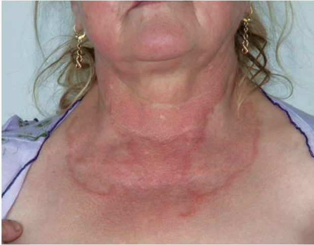
Obr. 3. Granuloma anulare – rozsáhlé anulární projevy

Generalizovaná forma GA (GGA) se vyskytuje v 8,5–15 % všech případů GA [5]. Je definována přítomností nejméně deseti současně se vyskytujícími anulárními ložisky nebo rozsáhlými anulárními ložisky (obr. 3) [32]; většinou jsou přítomny stovky malých, růžovo-fialových papul na trupu i končetinách, které mohou tvořit anulární ložiska [2]. Nejčastěji postihuje děti ve věku do 10 let a ženy ve věku nad 40 let [5]. Generalizovaná forma GA se vyznačuje dlouhou dobou trvání a mnohem nižším počtem spontánních zhojení. Výskyt generalizované formy bývá spojen s pozitivitou HLA-Bw35 antigenu [8].