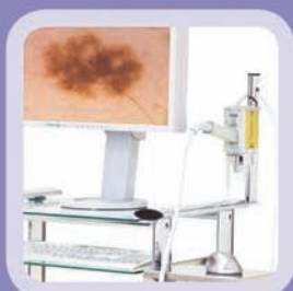
Nejvyšší obrazová Full HD kvalita