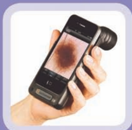
Ruční digitální dermatoskop