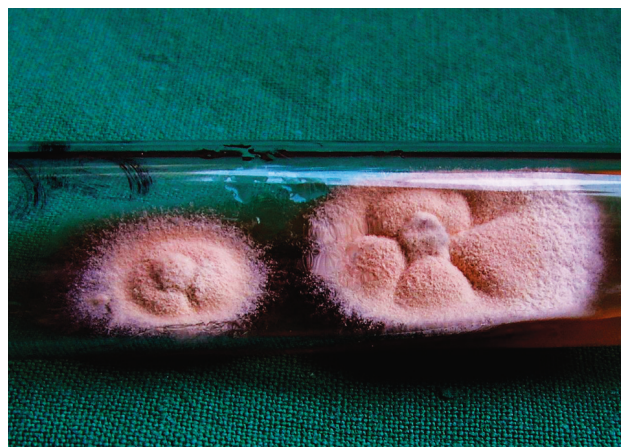
Obr. 3 a. Kultúra izolovaná zo šupín na ložisku – Trichophyton tonsurans

Ďalšími vyšetreniami sme zistili zvýšené markery zápalu FW 74/118, CRP 55,9 mg/l (norma do 10), Le 14,84 x 10 9 , znížené hodnoty Er: 3,61 x 10 12 , hemoglobínu 10,1 g/dl a hematokritu 30,2 %. Glukóza, hepatálne testy, úrea boli vo fyziologických hodnotách. Z hnisu sa kultiváciou zistili Staph. koaguláza negat. a Enterococcus faecalis. Boli stanovené diagnózy Tinea capitis profunda, Lymphadenitis occipitalis et colli a hypochromná anémia. Dieťa bolo liečené terbinafinom 125 mg p. o. denne 4 týždne, axetilcefuroximom 125 mg/5 ml v sirupe p. o. každých 12 hodín 10 dní, lokálne obklady KMnO 4 , mechanické odstránenie vlasov, Saloxyl ung., sol. iodi spirit. 5%, sírodecht 8% ung. Teplota ustúpila na štvrtý deň, bolestivosť, hnisanie, zápal aj infiltráty počas 2 týždňov. Markery zápalu pri kontrole o 11 dni boli vo fyziologických hodnotách.