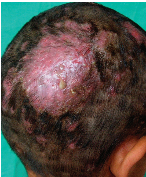
Obr. 1. Tinea capitis profunda

ných vlasov sa objavili ďalšie mierne infiltrované ložiská veľkosti 1–3 cm, spolu 12, s chýbajúcimi vlasmi, na okrajoch s krátkymi odlámanými vlasmi v rôznej výške (obr. 1). Mykologické mikroskopické vyšetrenie šupín odhalilo septované vlákna. Vyšetrenie vlasov preukázalo spóry v retiazkach vo vnútri vlasov – typ parazitizmu endothrix (obr. 2). Mykologická kultivácia s výsledkom Trichophyton tonsurans bola urobená v Mykologickom laboratóriu Detskej dermatovenerologickej kliniky LFUK a DFNSP. Kolónie mali svetlo hnedú farbu, jemný povrch podobný zamatu s výrazne sprehybaným povrchom a spodnej strane hnedé zafarbenie (obr. 3 a, b). Mikroskopickým vyšetrením z kolónií sme zistili relatívne široké hýfy s početnejšími septami s vetvením v pravom uhle, mikrokonídie rôznych tvarov a veľkostí, ojedinelé chlamydo-spóry.