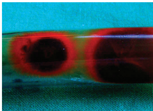
Obr. 3 b. Spodná strana izolovanej kultúry – Trihophyton tonsurans