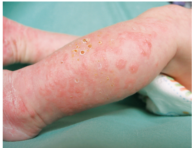
Obr. 2. Stav při přijetí

Při přijetí na kůži dominoval generalizovaný výsev drobných papulovezikul, kdy ušetřena zůstala pouze oblast hýždí, zad a hlavy (obr. 1, 2). Na ventrální straně trupu byla viditelná anulární erytémová ložiska, v jejichž okrajích byly viditelné papulózní a vezikulózní projevy. Ve dlaních a ploskách, také na hranách nohou byly napjaté číré buly. V pravé dlani dominovala bula velikosti asi 2 x 2 cm, již perforovaná, na zápěstích se nacházely zaschlé krusty. Sliznice dutiny ústní, očí a nosu ani nehtové ploténky nebyly postiženy.