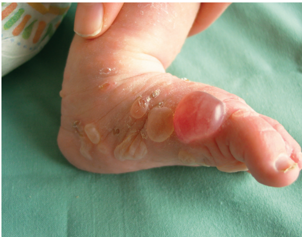
Obr. 1. Stav při přijetí