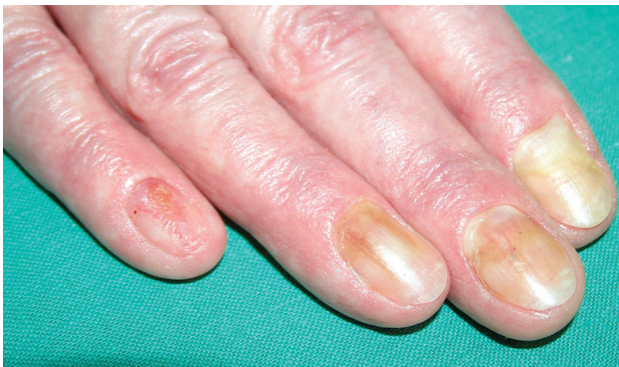
Obr. 1. Onycholysis a onychomadesis (na 5. prstu) při Lyellově syndromu po piroxikamu

Onychomadesis je spontánní odloučení nehtu v oblasti matrix, kdy odpadá celá nehtová ploténka (obr. 1).