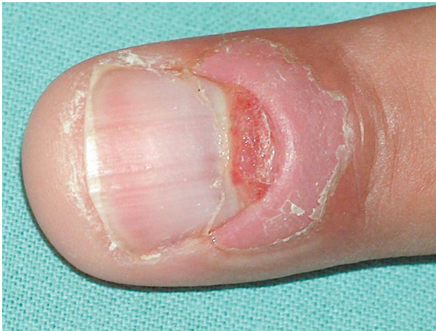
Obr. 2. Periunguální pyogenní granulom po etretinátu

maci. Ovlivnění nehtové matrix může vést k Beauovým liniím až k onychomadesis. Nehtové změny se objevují po 2 týdnech až 18 měsících od začátku léčby [21]. U psoriatiků léčených etretinátem jsou poměrně často popisována chronická paronychia přecházející až do obrazu pyogenních granulomů na nehtových valech [3, 11]. Vyvolává je retence šupin na spodní straně nehtového valu (obr. 2).