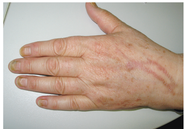
Obr. 5. Série Beauových linií po opakovaných cyklech i. v. chemoterapie. Na hřbetě ruky postflebitické hyperpigmentace po infuzích.

Při chemoterapii aplikované v krátkých, intenzivních pulzech dochází k tvorbě Beauových linií (obr. 5) až k onychomadésis. Může se také objevit výrazná transverzální leukonychie, zejména po cyklofosfamidu, adriamycinu a vinkristinu [9, 24]. Vedle pravé leukonychie, vyznačující se světlivě bílou barvou, se často objevuje i pseudoleukonychie – mléčné zakalení nehtových plotének. Může se projevit jako příčné Muehrckeho linie (viz obr. 4) nebo jako tzv. half-and-half nail, který je jinak popisován u renální insuficience (viz obr. 5). Pravá leukonychie je odrazem poruchy keratinizace přímo v nehtové matrix;