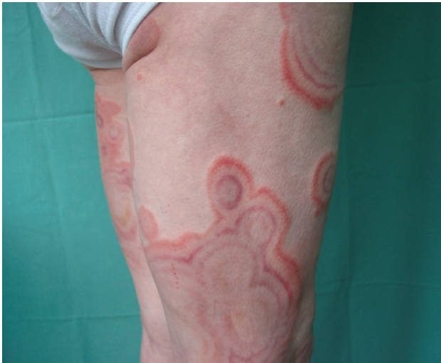
Obr. 2. Erythema gyratum repens

dromem anginy pectoris a hypotyreózou. Operována byla pro apendicitidu v roce 1956 a pro myomy dělohy v roce 1994. Žádným kožním onemocněním ani alergiemi netrpěla. Při přijetí udávala myalgie, artralgie, zvýšenou únavu, hmotnostní úbytek 10 kg za tři měsíce a stěžovala si na bolesti v epigastriu.