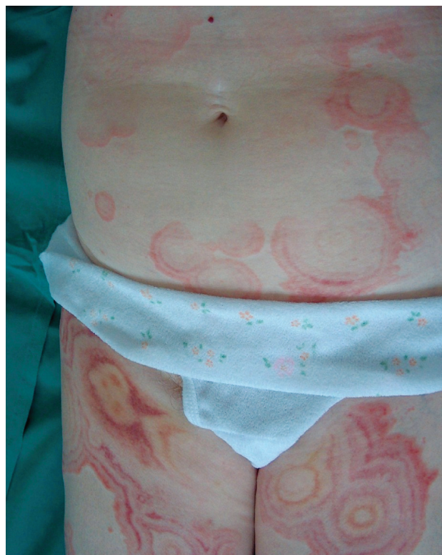
Obr. 1. Erythema gyratum repens

Žena (68 let) byla přijata k hospitalizaci pro tři týdny trávající výsev úporně svědících generalizovaných kožních projevů s nejméně postižením na stehnech a břiše. Předchozí přibližně třítýdenní léčba ve spádové kožní ambulanci antihistaminiky a lokálními kortikosteroidy byla bez efektu, objevovala se stále nová ložiska. Pacientka se léčila s chronickou ischemickou chorobou srdeční, se syn-