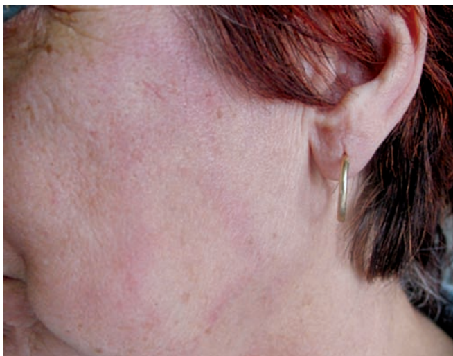
Obr. 2. Anulární erytém na tváři