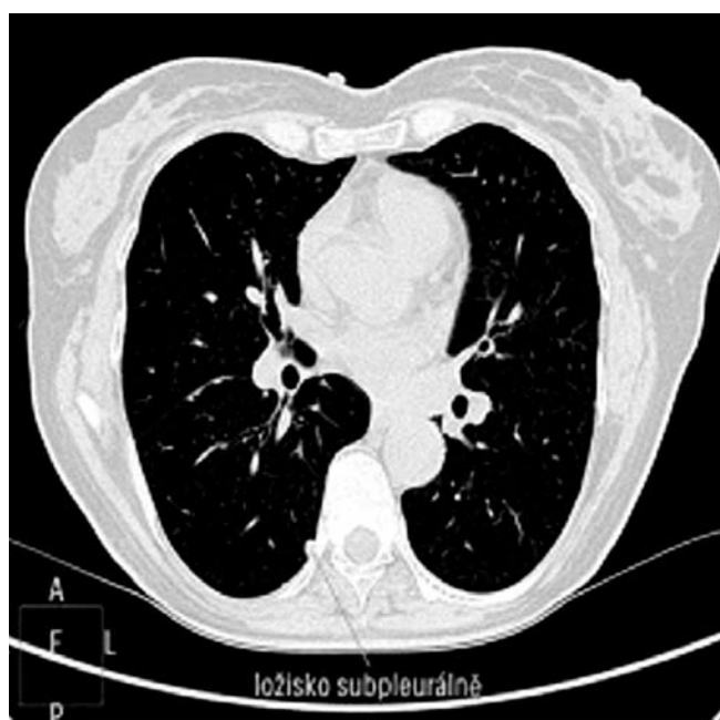
Obr. 4. Nález počítačové tomografie – subpleurální ložisko sarkoidózy

V téže době byla pacientka pro zhoršení očních potíží opakovaně vyšetřena oftalmologem a byl diagnostikován zánětlivý glaukom. Oční nález nebyl pro sarkoidózu charakteristický, chyběly uveitické uzlíky na duhovce i typické granulomy na sítnici. Kožní i plicní poškození velmi dobře regredovalo po nasazení celkové kortikosteroidní léčby Prednisonem (prednisonum) v dávce 0,8 mg/kg hmotnosti a den s postupnou redukcí dávky o 0,2 mg/kg/den vždy zhruba po třech týdnech. Za 3 týdny od zahájení této léčby došlo k podstatnému zlepšení ichtyoziformních projevů, erytém na obličeji zcela regredo-