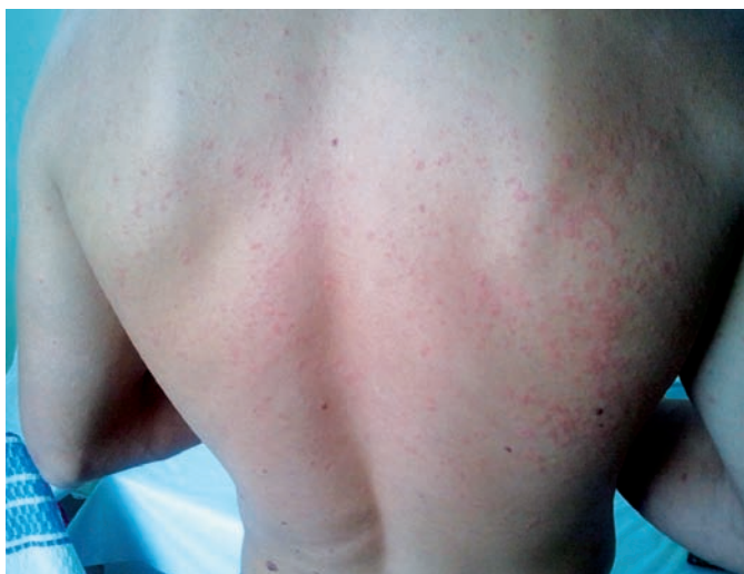
Obr. 3. Idová reakcia