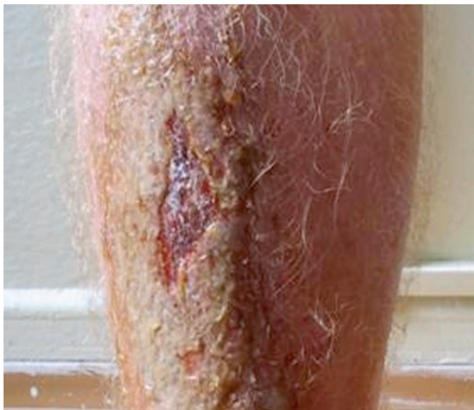
Obr. 1. Predkolenie

javy úporne svrbeli a pacient si ich škriabal. Objektívne bol na pravom predkolení prítomný erytém a edém polotuhej konzistencie siahajúci od dorza pravej nohy pod pravé koleno, na pohmat koža teplejšia oproti ľavému predkoleniu (obr. 1).