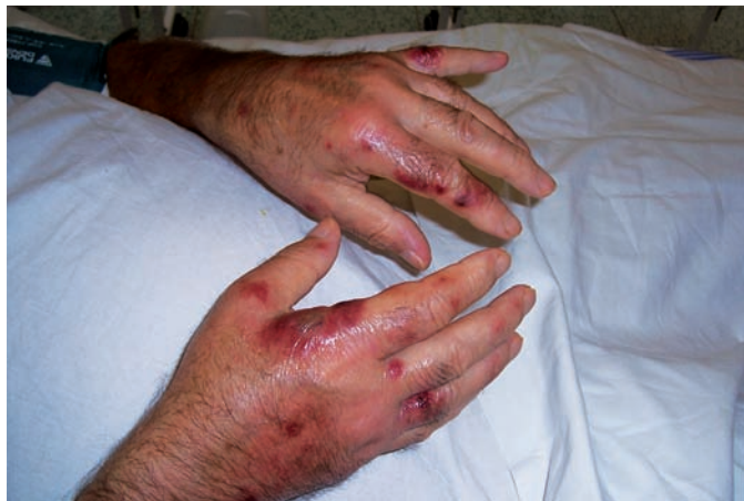
Obr. 1. Klinický obraz – kazuistika 1

7,33 \mu\text{kat/l} (norma 0,15–0,75), alfa- amyláza 0,8 \mu\text{kat/l} v normě (norma 0,1–1,7). Na rentgenovém snímku srdce a plic byla patrna elevace pravé bránice, ostatní nález byl bez patologie, sonografie popsala subfrenickou kolekci tekutiny. CT vyšetření břicha verifikovalo biliom („náborový“ útvar vzniklý nahromaděním žluči) v pravém subfreniu. Byla provedena drenáž této kolekce s úpravou antibiotické léčby – p. o. sultamicilin byl po 7 dnech užívání nahrazen i. v. cefoperazonem v dávce 1 g 2krát denně. Endoskopická retrográdní cholangiopankreatikografie popsala normální nález bez úniku kontrastní látky mimo žlučové cesty.