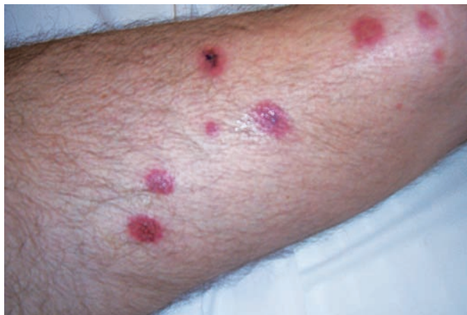
Obr. 2. Klinický obraz – kazuistika 1