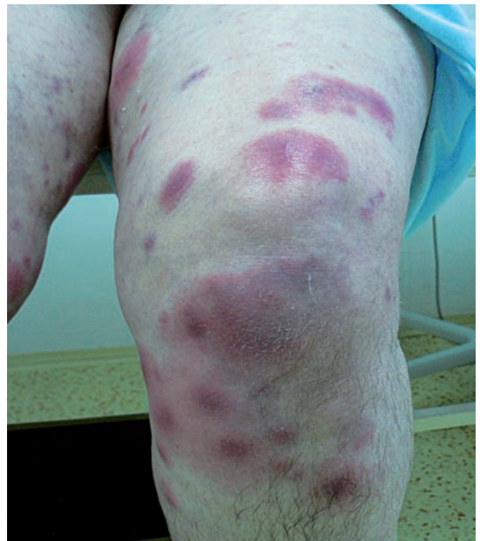
Obr. 5. Klinický obraz – kazuistika 2