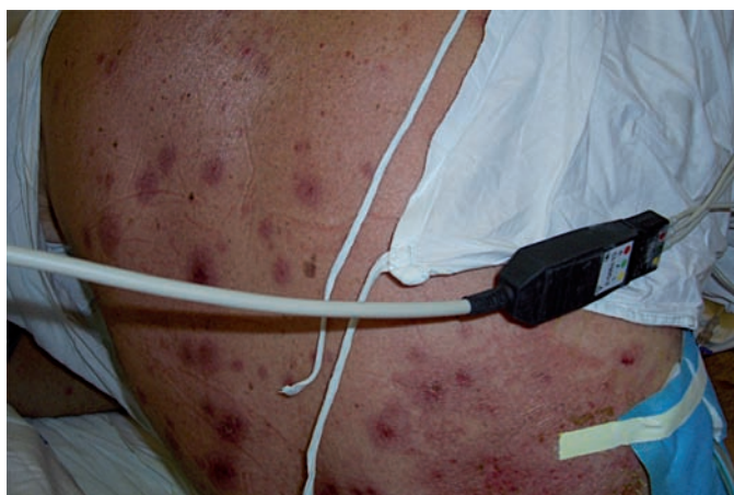
Obr. 3. Klinický obraz – kazuistika 1