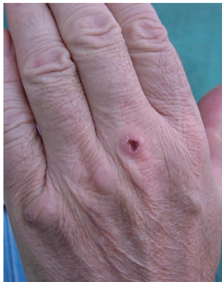
Obr. 3. Klinický nálezn na dorzu levé ruky v září 2009