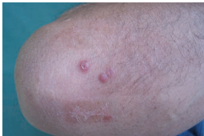
Obr. 1. Klinický nálezní obrázek necharakteristických papul u pacienta na pravém lokti v září 2009

V září 2009 byl vyšetřen na kožní ambulanci pro asi týden trvající asymptomatické kožní projevy. Objektivně bylo přítomno několik růžových tuhých papul s hemoragickou krustou v centru na obou loktech, levé ruce a na pravém uchu (obr. 1, 2, 3).