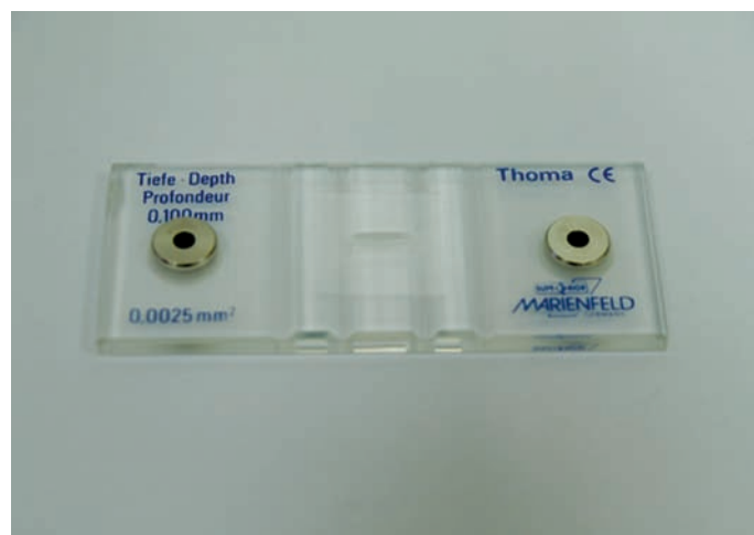
Obr. 1. Thomova komůrka

Většinou, ale není to pravidlem, jsou všechna kritéria v určitém vzájemném souladu. Bez klinického vyšetření, popř. dalších výsledků, nelze úroveň plodnosti dobře zhodnotit.