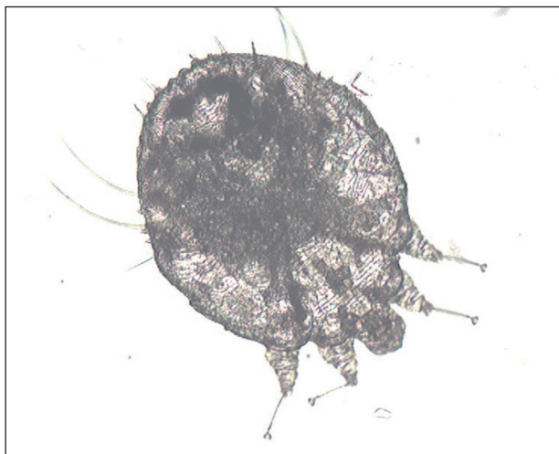
Obr. 5. Mikroskopický nález Sarcoptes scabiei (Danilla T.)

Mikroskopické vyšetrenie z líca aj z hlavy, z nánosov šupín z dlaní aj stupají preukázalo prítomnosť dospelých samičiek a vývojových štádií Sarcoptes scabiei (obr. 4, 5). U matky bolo mikroskopické vyšetrenie tiež pozitívne.