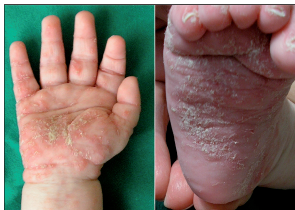
Obr. 3. Scabies crustosa hyperkeratózy a chodbičky (Danilla T.)