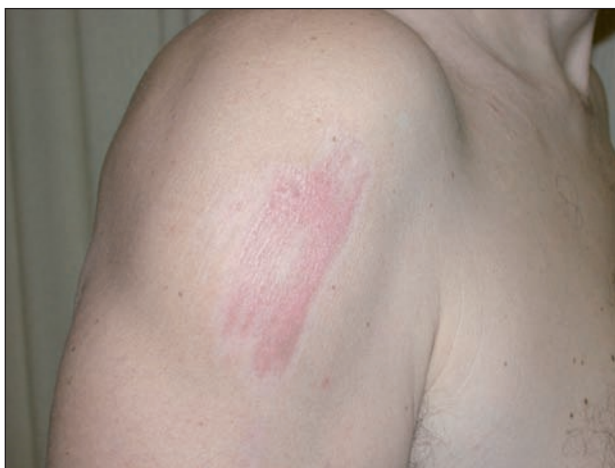
Obr. 2. Pacient měsíc po zranění

Pacient (51 let), zdravý, alergiemi netrpící sportovně založený lékař se při šnorchlování v Rudém moři škrábl na pravém rameni o drsný povrch korálového útesu. Po 5–10 minutách udával silné pálení. Po ošetření masť s 0,5% prednisolonu a 3% clioquinu a roztokem 10% jód-polyvidonu došlo k úlevě. Během dalšího pobytu u moře po dobu 5 dnů při koupání ve slané vodě rána silně štípala, nicméně neomezila aktivity pacienta včetně slunění při aplikaci SPF 50+. Pacient se od návratu domů léčil nepravdělnou aplikací kortikosteroidních extern – za měsíc bylo ložisko stále zarudlé, sestávající z lineárně uspořádaných splývavých lesklých červenohnědých makulopapul, citlivé na pohmat (obr. 2). Během dalšího měsíce došlo k postupné regresi klinických projevů. Za dva roky byly stopy po zranění stále zřetelné s depigmentací a hypertrofickou plošnou jizvou, i když postižený tvorbou hypertrofických nebo keloidních jizev netrpí.