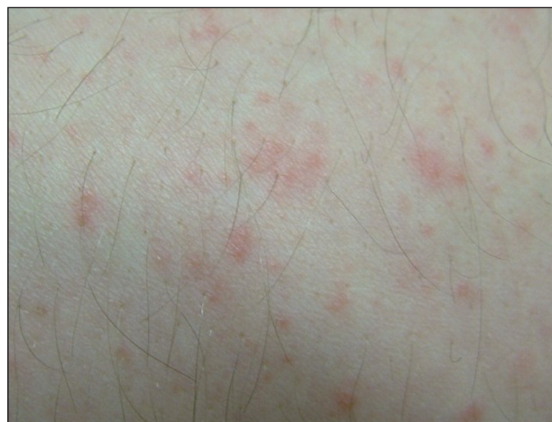
Obr. 2. Detail drobných papulopustulek na zánětlivé spodině bez folikulární vazby

Bylo provedeno bakteriální kultivační vyšetření obsahu pustuly a probatorní biopsie projevu z oblasti nad loketní jamkou. V histologickém nálezu bylo popsáno široce dilatované akrosyringium s pustulou polynukleárů, které byly v menším počtu přítomny i v okolním horním koriu, spolu s nečetnými lymfocyty (obr. 3, 4). Kultivačně byl zachycen pouze Staphylococcus epidermidis ojedinele, myko-