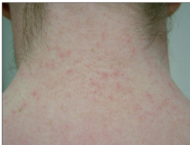
Obr. 1. Vícečetný výsev drobných papulek a pustul na zánětlivé spodině na šíji pacienta s miliaria pustulosa

Časově udával pacient vznik výsevu v srpnu 2010. První projevy se objevily na hrudníku a v oblasti beder, následně došlo postupně ke generalizaci projevů na šíji, břicho, paže, předloktí a na zadní strany bérců. Projevy svědily, až pálily. Pacient vyhledal kožního lékaře v místě bydliště na přelomu září a října 2009. Z lokální léčby mu byla předepsána magistraliter leniens mast s dexametazonem a celkově byl nasazen levocetirizin v dávce 5 mg/den (Xyzal tbl.). Díky této terapii však nedošlo ke zlepšení obtíží a léčba byla upravena na 0,01% mast s mometazon furoátem 1krát denně (Elocom ung.) a k celkové terapii byl přidán bisulepin 2 mg na noc (Dithiaden tbl.). Dále již nedošlo k další progresi projevů,