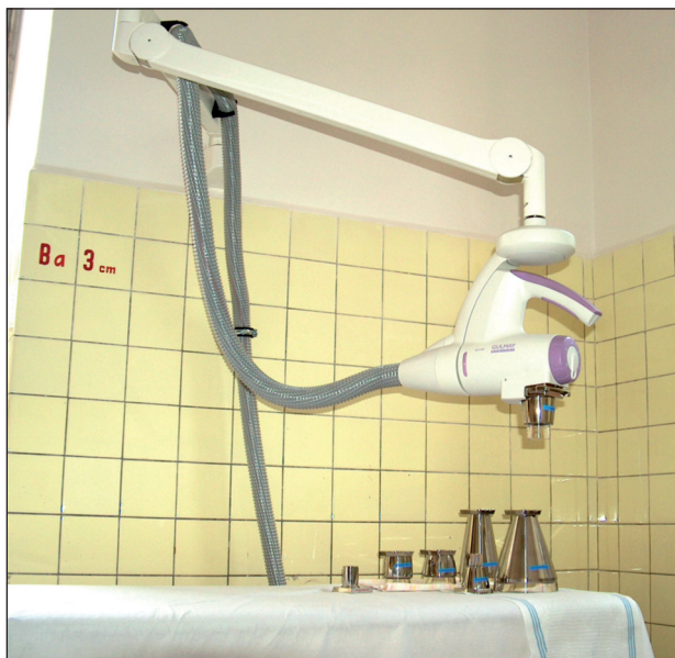
Obr. 4. Nový přístroj pro terapii Buckyho paprsky.

vycházejí, je tzv. Lindermannovo okénko. Je vyrobené z křehkého skla, v němž křemičitany jsou nahrazeny boráty, a sodík, draslík a vápník lithiem a beryliem. I toto sklo pohlcuje ještě asi 50 % vznikajícího záření, jež je délky mezi 1 Å a 3 Å (1 Å = 1 \cdot 10^{-10} m = 0,1 \cdot 10^{-9} m = 0,1 nm). Paprsky větší vlnové délky se rychleji pohlcují ve vzduchu. Proto se také v praxi přesně měří vzdálenost ohniska od kůže. Paprsky 2 Å se pohlcují v 10 cm vrstvě vzduchu z 20 %, paprsky 3 Å ze 40 %. Absorpce v kůži je ovšem daleko vyšší. Záření 3 Å ztrácí polovinu své intenzity v 0,2 mm, záření 2 Å v 1 mm hloubky kůže. Protože většina paprsků je průměrné délky 2 Å, pohlcuje se většina záření v epidermis a v horním koriu. Záleží to na tloušťce kůže, lokalizaci a druhu onemocnění. Terapeutické dávky takřka nezasáhnou hlubší korium a subcutis. Proto se při něm nevyskytují hluboké, bolestivé RTG ulcerace. Z těchto poznatků vychází i terapie tímto zářením v případě odpovídajících diagnóz (obr. 3 a 4).