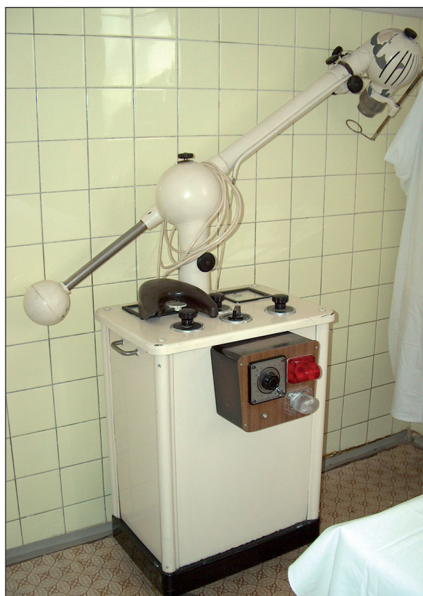
Obr. 3. Buckyho přístroj.