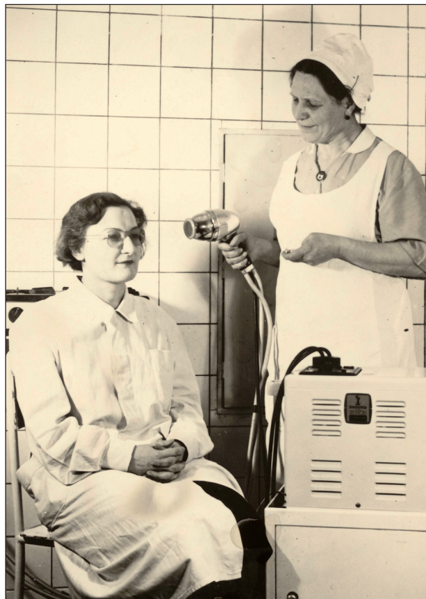
Obr. 2 Ukázka užívání Chaoulovy lampy.

Buckyho lampa (Gustav Bucky – německý rentgenolog). Ještě nižší napětí se užívá u Buckyho lampy, která vydává tzv. hraniční paprsky; „hraniční“ proto, že jejich vlnová délka je poměrně velmi dlouhá, na hranici mezi ultrafialovým zářením a X-paprsky. Tyto paprsky by se normálním sklem skoro úplně pohltily. Na místě, kde z lampy