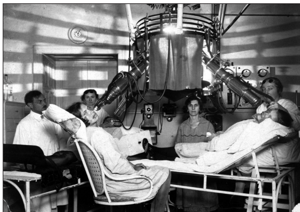
Obr. 3 Finsenova lampa k dispozici na klinice již v roce 1922.

hochů - když už vycítili, že jejich boj je skončen, bylo: vrátit se domů. Velká většina jich má zdravý, opravdu demokratický a spravedlivý názor životní. Nakonec se i A. Trýb vrátil přes Japonsko a Ameriku do vlasti. V roce 1920 byl jmenován mimořádným profesorem a přednostou kožní kliniky v Brně, řádným profesorem v r. 1923 a v letech 1927–8 byl děkanem lékařské fakulty v Brně (obr. 2, obr. 4, obr. 5, obr. 6). Po návratu na nové klinice překonával úspěšně nejen byrokratické potíže, ale i zásadní nedostatky ve vybavení nového pracoviště, kde ho v knihovně čekal pouze telefonní seznam a v nemocnici lékaři, kteří zvládali jen rutinní výkony. Brzy přebudoval pracoviště kožního zemského oddělení na kliniku, která odpovídala i mezinárodním parametrům (obr. 3). A v roce 1928, kdy se v Brně, tehdy známém středisku československé moderny, na nově vybudovaném výstavišti v Pisárkách, konala celostátní výstava soudobé kultury, Trýb pro ni připravoval materiálově i ideově lékařskou expozici, kterou – ač už děkanem – pomáhal také instalovat. Kritiky byla hodnocena jako velmi zdařilá.