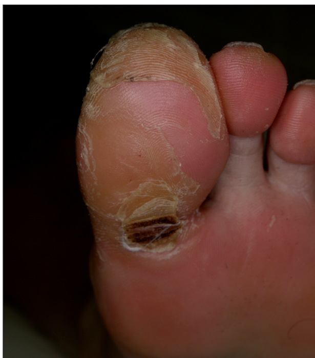
Obr. 11. Syndrom ruka-noha při léčbě sorafenibem.

Sorafenib (až v 48 %) a sunitinib (v 36 %) mohou způsobit za 3 až 4 týdny kožní reakce na ruku a nohu označované jako syndrom ruka-noha (anglicky hand-foot skin reaction ), které se liší od akralních erytémů pozorovaných při klasické chemoterapii (taxany, cytosin arabinosid, 5-fluorouracil aj). V místech tlaku (paty, hlavičky metatarzů) vznikají ostře ohraničené, erytémové, prosáklé otlaky, které jsou silně bolestivé a zhoršují se v horku (obr. 11).