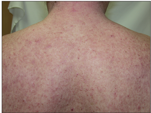
Obr. 3. Akneiformní exantém po erlotinibu.

Pro nežádoucí kožní změny vyvolané antagonisty EGFR se zavedl název PRIDE syndrom (z angl. P apulopustules and/or P aronychia, R egulatory abnormalities of