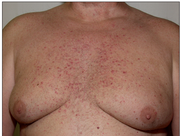
Obr. 4. Akneiformní exantém po cetuximabu.