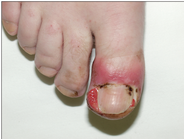
Obr. 9. Paronychia při léčbě EGFR inhibitory.

infúzní reakce (14), podobně i po trastuzumabu, vzácně je popsána vaskulitida a exacerbace psoriázy.