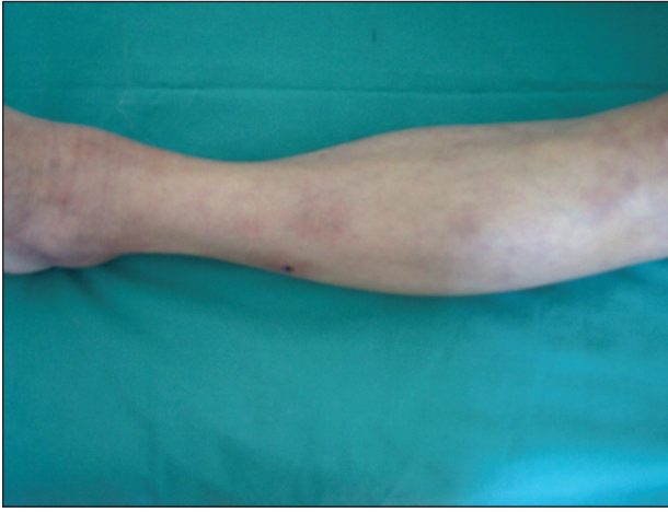
Obr. 1. Metastatická varianta Crohnovy choroby klinického obrazu erythema nodosum.