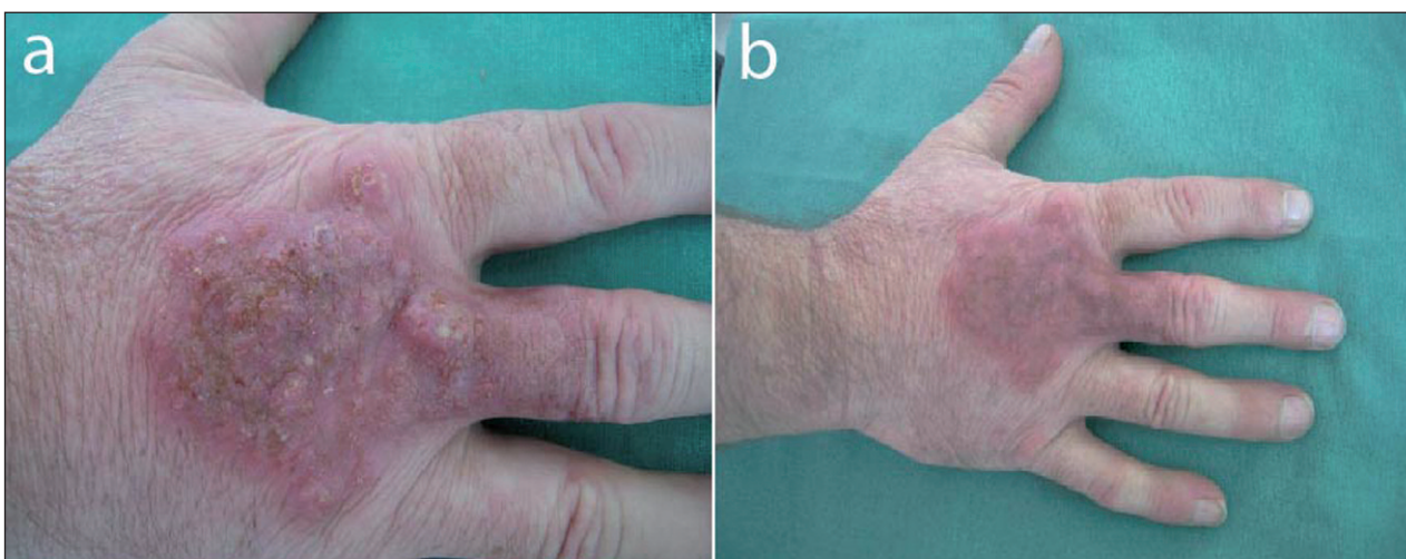
Obr. 2. Pacient č.2: a) dorsum pravej ruky – pred liečbou, b) dorsum pravej ruky – po 4 týždňoch liečby klindamycínom.

s následným perorálnym podávaním v dávke 4 x 600 mg. Lokálna terapia zahrňovala antibiotickú a jódovú externú.