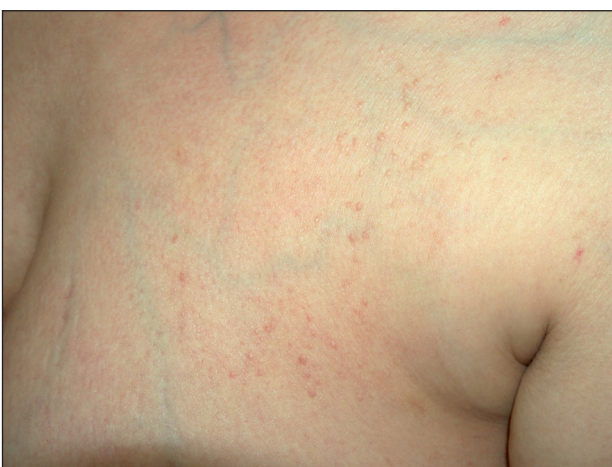
Obr. 2. Lichen amyloidosus – laterální strana hrudníku.