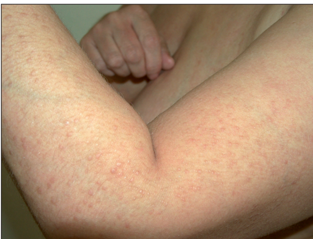
Obr. 1. Lichen amyloidosus – laterální strana levého předloktí a paže.