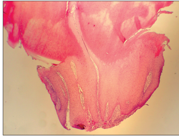
Obr. 3. Gigantický kožní roh, histologický nález, hematoxylin/eozin, 40x.