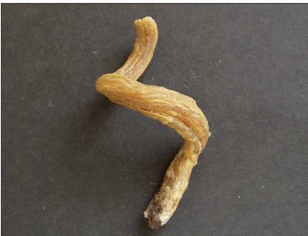
Obr. 2. Gigantický kožní roh po snesení.