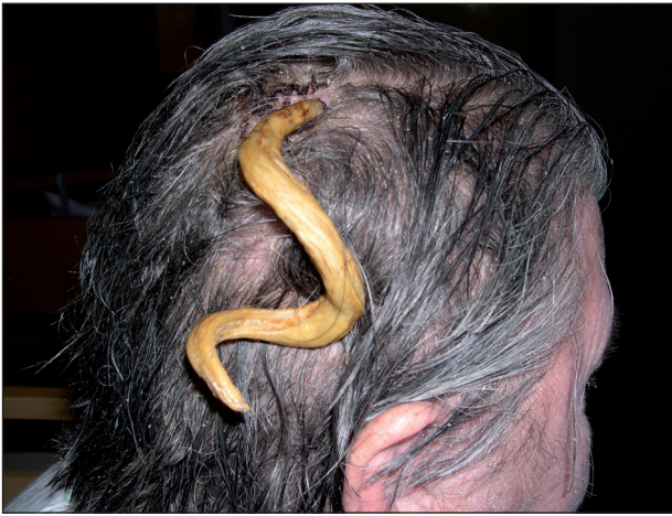
Obr. 1. Gigantický kožní roh ve kštici.